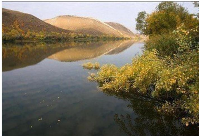
Горы «Две сестры», Белая Калитва