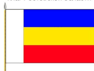
Флаг Ростовской области

Минеральное сырьё включает группу топливно-энергетических ресурсов, среди них — каменные угли Восточного Донбасса, в особенности антрацит, самый лучший в мире по калорийности. Разрабатываются месторождения нерудного сырья для металлургии и производства строительных материалов. Разведанные запасы газоцениваются в 56,2 млрд м 3 . Имеются также месторождения железной руды, флюсовых известняков, строительных материалов, поваренной соли, природного газа.