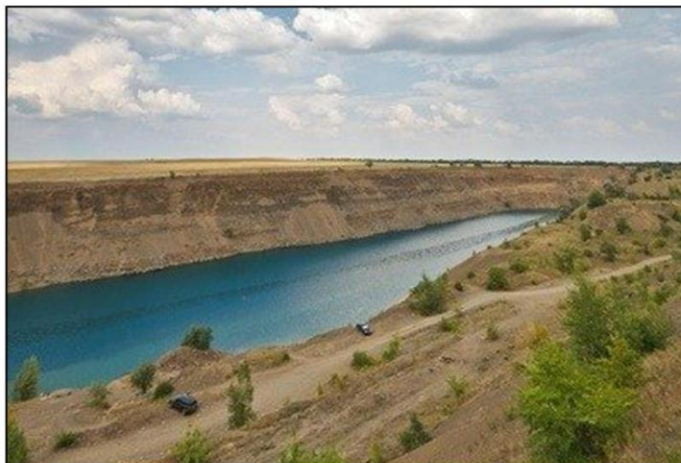
Долгий каньон, Каменск-Шахтинский