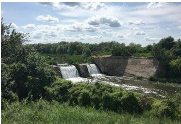
Прохоровская плотина, Красный Сулин