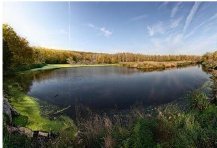
Щепкинский лес, Ростов-на-Дону