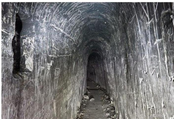
Мигулинские пещеры, Мигулинская