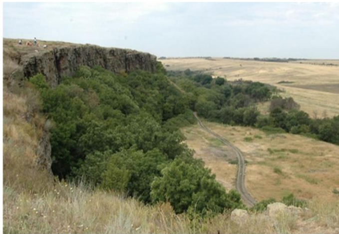
Зайцевские скалы, Звереве