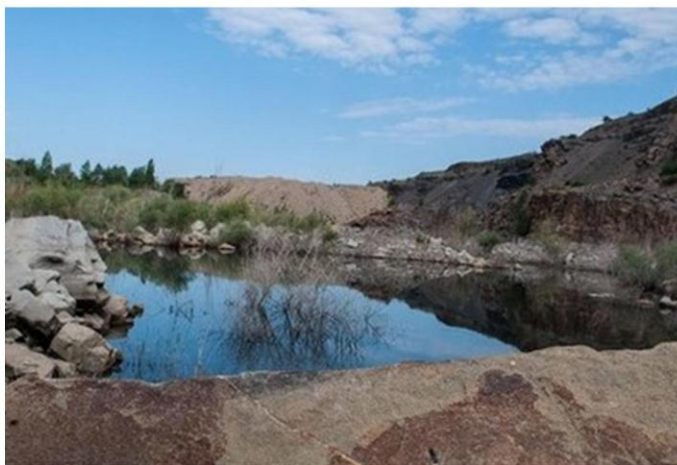
Аникинский каньон, Каменск-Шахтинский