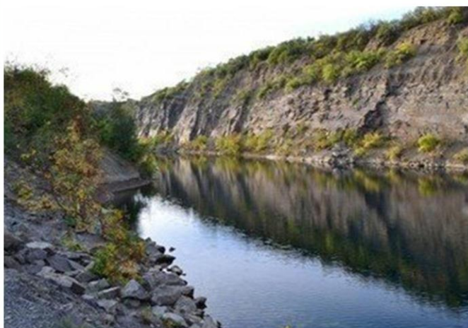
Каньон Красный Сулин, Красный Сулин