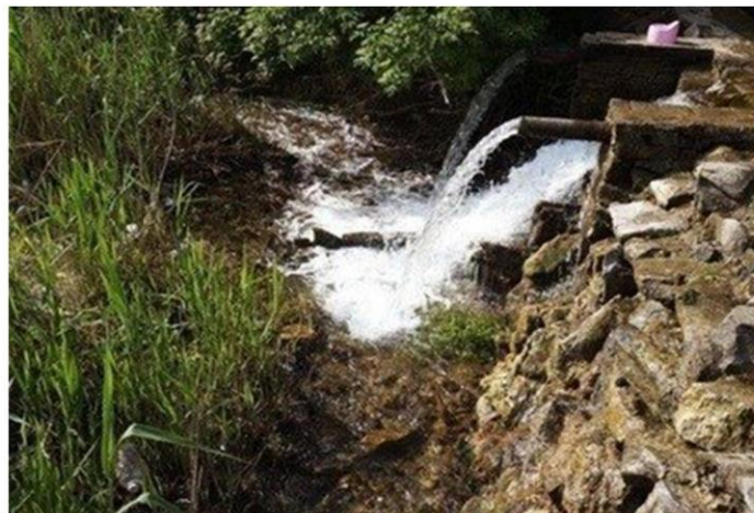
Родник Водопадный, Ростов-на-Дону