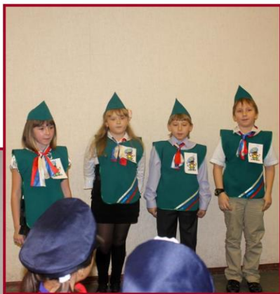
С. 2 (красный, зеленый)