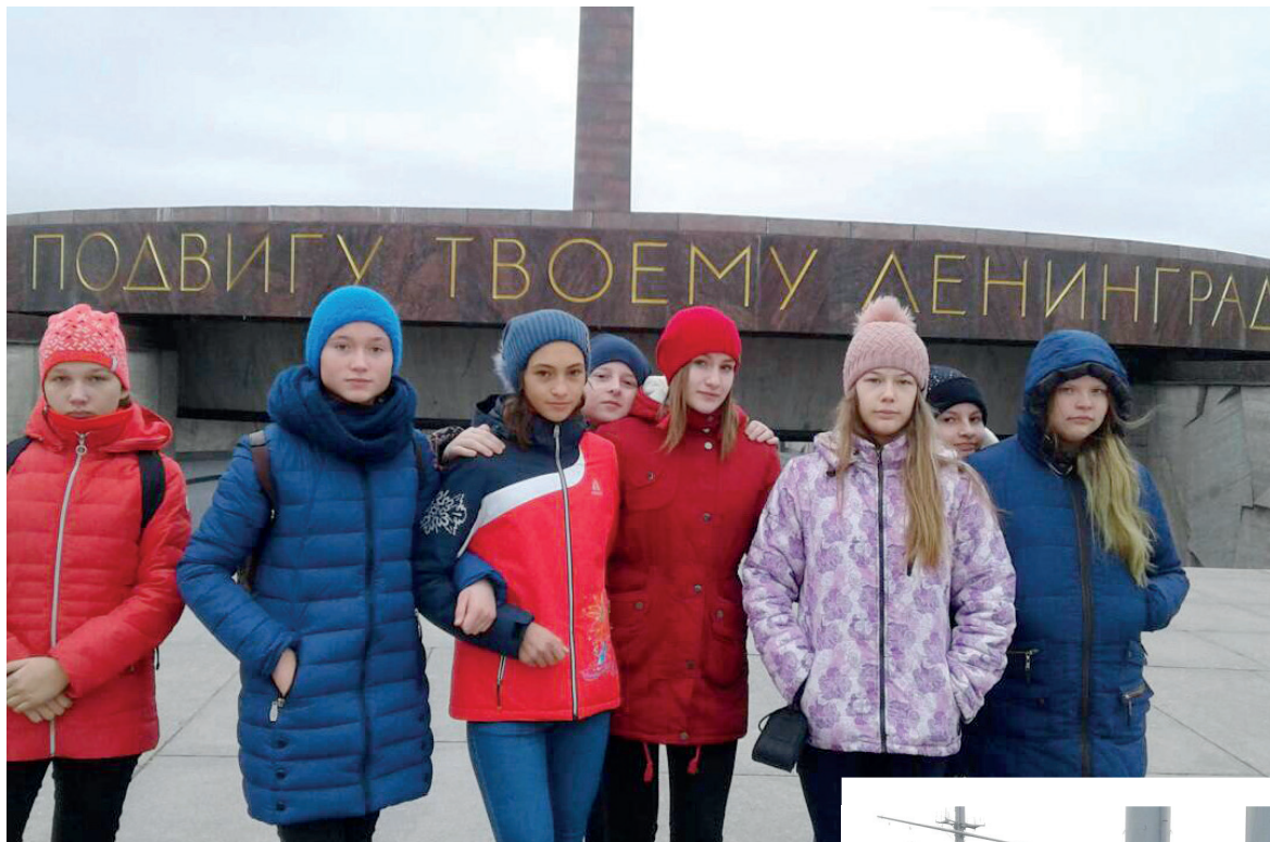
— Жители Санкт-Петербурга свято чтят историю своего города. Монумент героическим защитникам Ленинграда — памятник, глубоко трогательный за душу