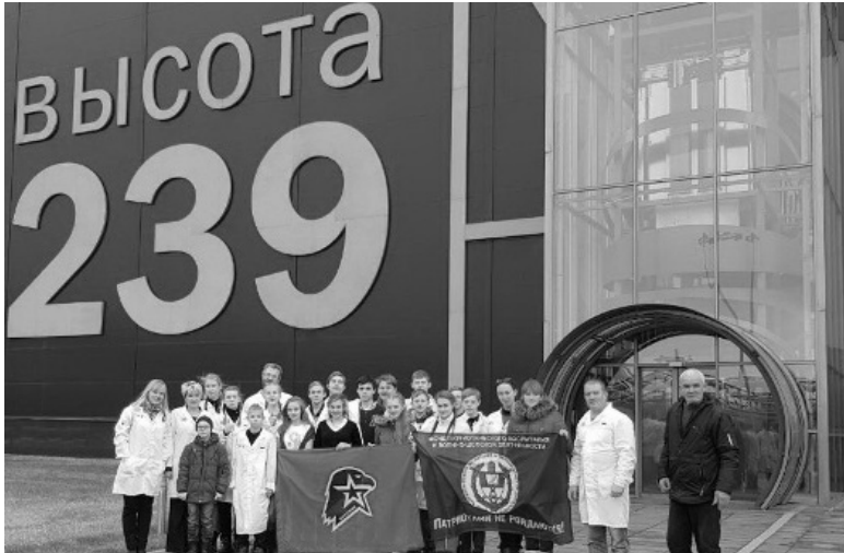
Автопробег предполагает профориентацию молодёжи, а потому маршрут включал посещение комплекса «Высота 239» Челябинского трубопрокатного завода