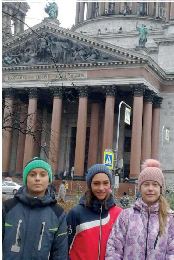
Исаакиевский собор — один из символов Санкт-Петербурга. В нём всё пронизано духом истории