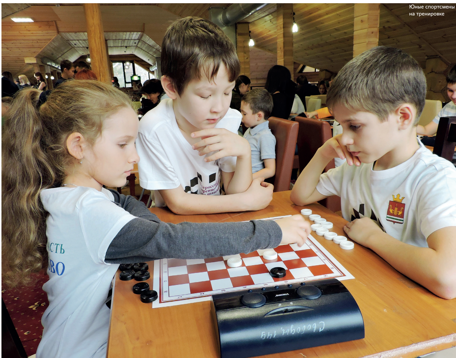
Юные спортсмены на тренировке

— в почтовом отделении. Подписной индекс 54625