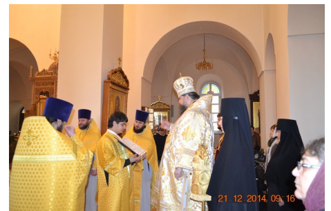
Всенощное бдение. Служба.

именно у этого дуба Аврааму явились три ангела.