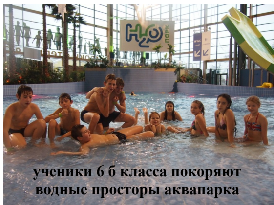
ученики 6 б класса покоряют водные просторы аквапарка