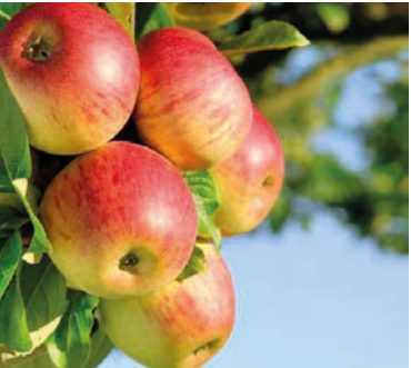
Плоды у сорта яблони Башкирская красавица гладкие, правильной округлой формы, окраска — светлая, с полосатым малиновым румянцем

Сорта яблонь и груш очень много. На вкус и цвет, как говорится, товарищей нет. Поэтому надо читать аннотации по сортам, внимательно их изучать, советоваться с опытными садоводами. Лучше всего покупать те сорта, плоды которых вы попробовали и они вам понравились.