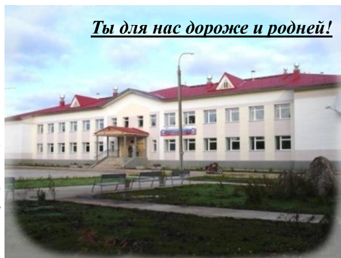
Ты для нас дороже и родней!

Празднование юбилейной даты запланировано с 3 по 9 октября 2016 года. В рамках этой недели намечены различные познавательные мероприятия, дни открытых дверей, встречи с выпускниками прошлых лет, ветеранами педагогического труда и, конечно же, праздничный концерт! Будет приложено очень много сил для того, чтобы сделать юбилейную неделю яркой и содержательной. А пока главное – хорошее окончание учебного года. Это обязательно станет лучшим вкладом в подготовку к предстоящему мероприятию, юбилейная дата будет встречена достойно!