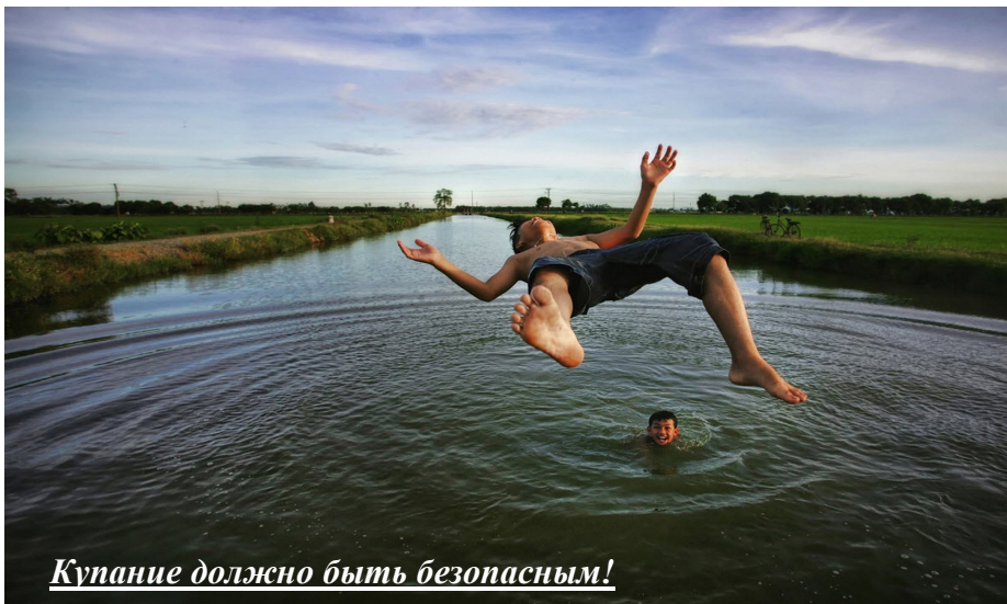
Купание должно быть безопасным!