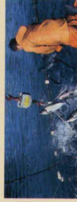
рыбаком прибрежного лова