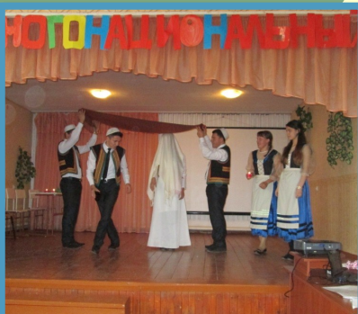
11 класс представляет еврейский народ

Культура этноса – это совокупность культурных явлений, необходимых народу для его жизнедеятельности. Изучая культуру других народов (язык, одежду, традиции, обряды, фольклор), мы обмениваемся духовными контактами, а следовательно лучше понимаем друг друга, а значит, мы учимся дружить и становимся ближе.