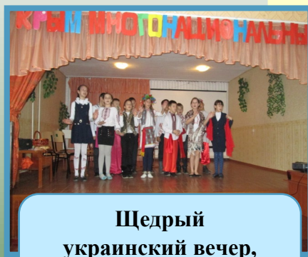
Щедрый украинский вечер, 6 класс

17 ноября в МБОУ «Константиновская школа» состоялся ежегодный традиционный фестиваль «Крым многонациональный». Данное мероприятие дает возможность каждому классу представить один из народов, проживающих в Крыму. Ребята рассказывают об истории и культуре народа, готовят национальные блюда, рисуют стенгазеты и показывают номер художественной самодеятельности. Благодаря таким мероприятиям, учащиеся учатся понимать, что такое толерантность для многонационального Крыма. Понимание толерантности, признание того, что люди по своей природе отличаются внешним видом, языком, поведением и имеют право сохранять индивидуальность, является важным для сохранения мира и согласия в Республике Крым.