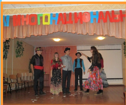
Свадебный цыганский обряд в исполнении 10 класса

Крым – уникальная земля, история которой тесно переплелась с историей народов, проживающих здесь. Татары, русские, болгары, греки, украинцы, армяне, караимы сплелись настолько тесно, что вряд ли кому удастся распутать этот вековой клубок. Крым – миниатюрный пример любви и терпимости.