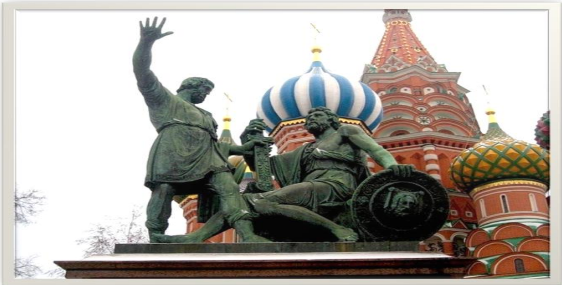
Кузьма Минин и Дмитрий Пожарский