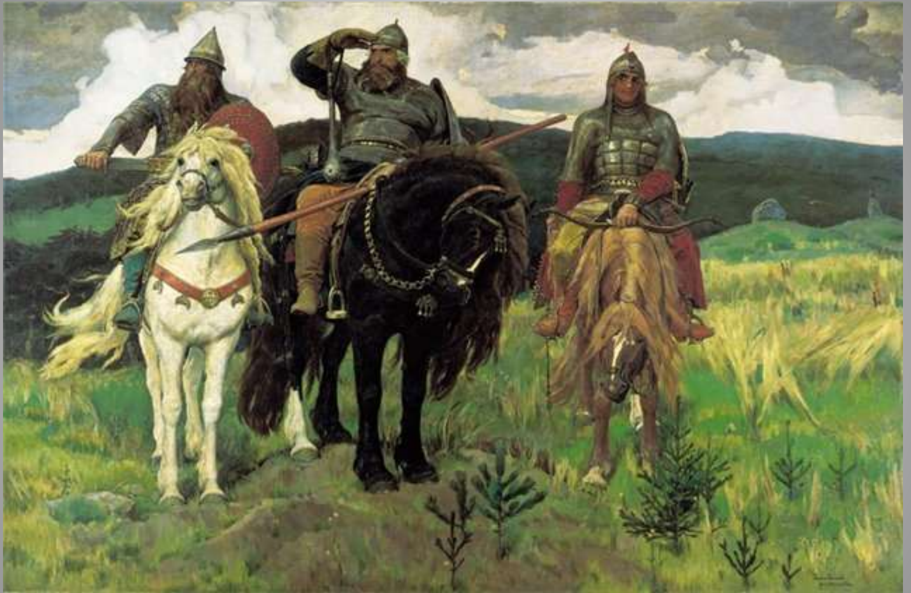
В. Васнецов «Богатыри»