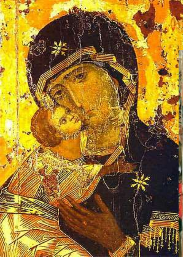
Икона Владимирской Богородицы