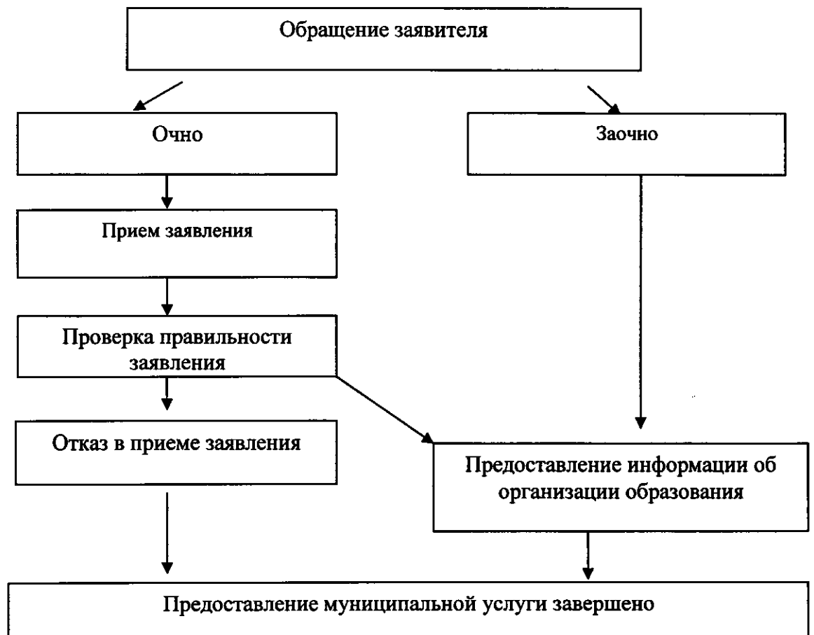
Блок-схема предоставления муниципальной услуги

Начальник управления образованием администрации муниципального образования Павловский район