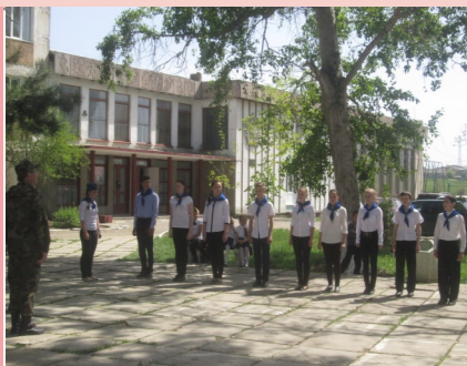
Выступление 9 класса

Третьего мая в МБОУ «Константиновская школа» состоялся конкурс «Строй смотра и песни». Все классы ответственно готовились к данному мероприятию. Ребята совершенствовали навыки строевых