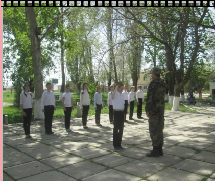
Выступление 6 класса

упражнений, разучивали военные песни и в очередной раз убеждались, что песня помогает человеку в любое время: во время войны и в мирные дни, что без песни скучно и неинтересно жить.