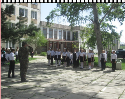
Выполнение строевых упражнений, 3 класс