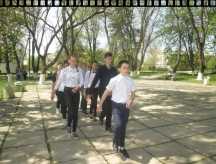
Маршировка 8 класса