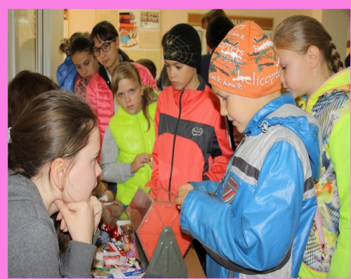
На ярмарке всем интересно!