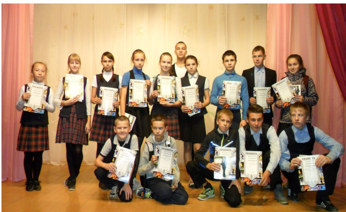
Победители и призеры школьного кросса «Золотая осень»