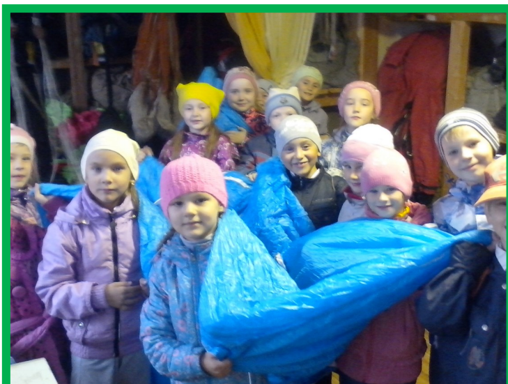
Ребята из 1 «Б» класса.