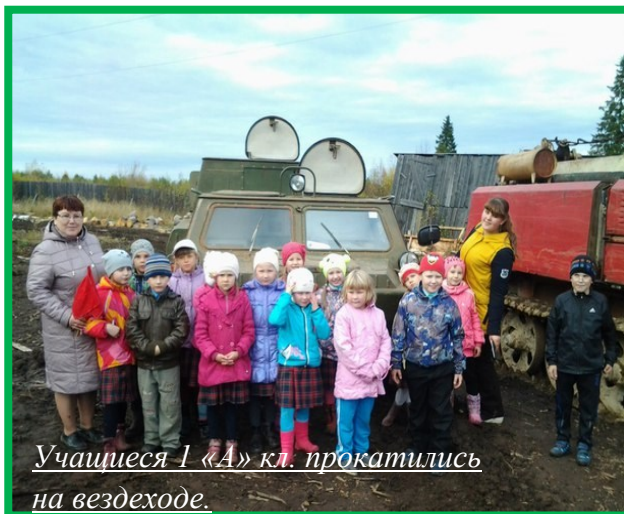
Учащиеся 1 «А» кл. прокатились на вездеходе.

риод с 21 по 28 сентября организовали экскурсии в ЕЛЦ (единственный лесопожарный центр). 149 учащихся МБОУ «Лешуконская средняя общеобразовательная школа» из 1-7 классов со своими классными руководителями побывали на экскурсиях. Всего для учащихся нашей школы было организовано 9 экскурсий. В программе: интересная беседа работников ЕЛЦ о своей работе, демонстрация работы лесопожарной техники, тушение условного лесного пожара, знакомство с парашютами и снаряжением парашютистов-пожарных, работа де-