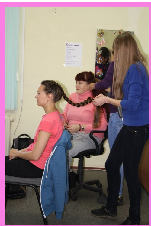
В салоне красоты