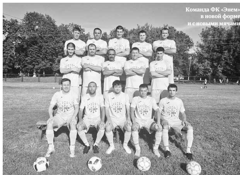
Команда ФК «Энем» в новой форме и с новыми мячами

Напомним, что команда ФК «Энем» неоднократно становилась победителем и призером первенства города Краснодара по футболу. Так что, пожелаем нашим землякам повторить этот успех.