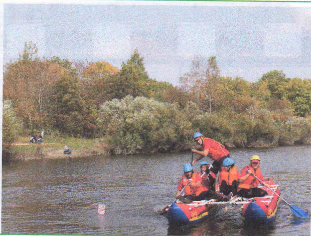
Фото из архива 2016г. Впервые участие МКДОУ «Звездочка» в районном туристическом слете

2017 год, второе участие в районном туристическом слете и снова первое место в номинации «Визитная карточка»