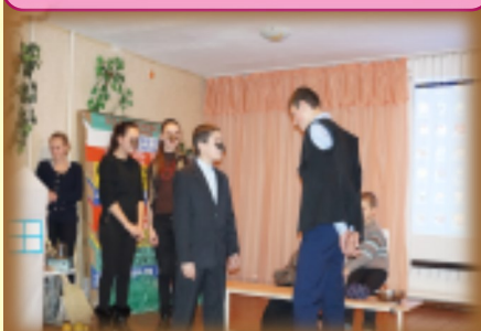
Инсценировка сказки «Подарки черного ворона» в исполнении 9 класса