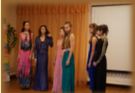
Инсценировка немецкой сказки в исполнении 7 класса