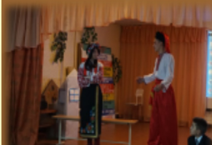
Оксана и Вакула (эпизод из повести Н.В. Гоголя «Ночь перед Рождеством»), 11 класс