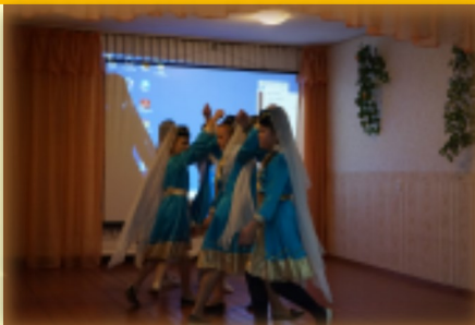
5 класс представляет армянский танец

Огромное впечатление на присутствующих произвело выступление 9 и 11 классов. Грузинская сказка девятиклассников под названием «Подарки черного ворона» отождествляет такие человеческие пороки как зависть и жадность. Царь настолько жаден, что забирает у крестья-