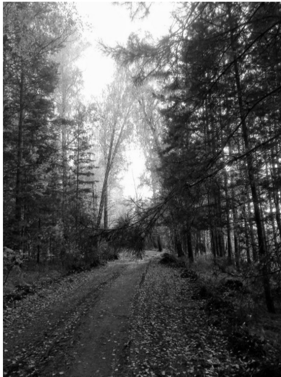
Редакция «Искры» уже протестировала тропу здоровья вдоль озера Еткуль. До посёлка Санаторного и обратно шагалось легко, полотно ровное. Дорогой встречали группы велосипедистов