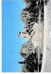
Памятник Неизвестному солдату г. Волгоград (Сталинград)