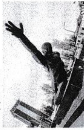
Памятник неизвестному солдату г. Казань

Могила Неизвестного солдата - памятник погибшим во время войн военнослужащим, личность которых установить не удалось. Первый такой памятник был установлен в 1858 году в Дании. В XX веке первые могилы (мемориальные комплексы) Неизвестного солдата появились в 1920 году в Великобритании и Франции. В 1921 году церемонии захоронения Неизвестного солдата прошли в США, Италии, Бельгии и Португалии, в 1922 году - в Чехословакии и Югославии, а в 1923 году - в Румынии, до конца 1920-х годов подобные мемориалы были сооружены в Болгарии, Австрии, Венгрии, Польше и Греции. В мире свыше 40 памятников Неизвестному Солдату, большинство посвящено павшим в двух мировых войнах. Традиция, по которой нации и государства устанавливают памятники Неизвестному солдату, символизирует память, благодарность и уважение всем погибшим солдатам.