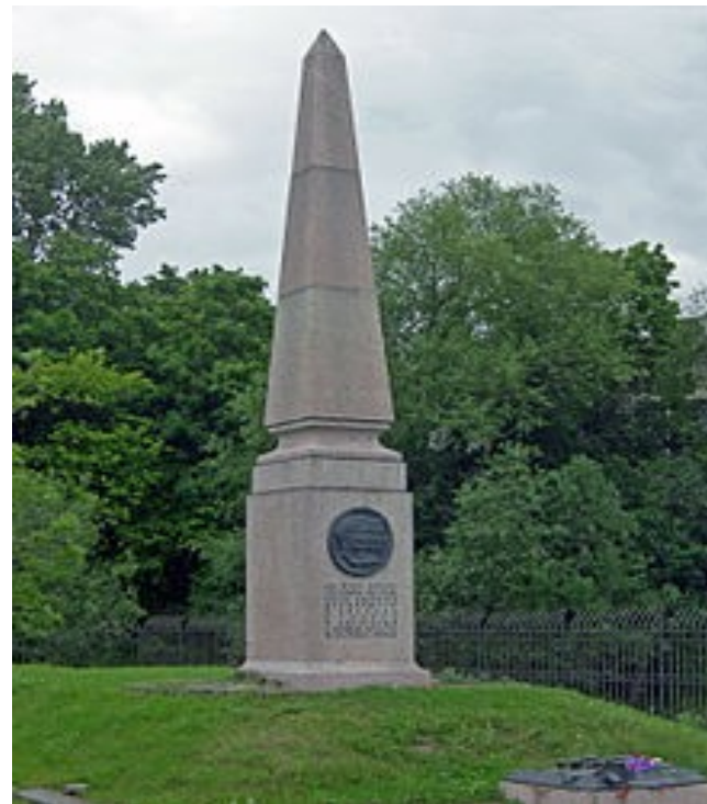
Обелиск на месте казни 5 декабристов в Санкт-Петербурге

Вот только в чём заключалась «революционность» выступления декабристов – историки спорят и по сей день. Высочайшее дарование гражданских свобод, отмены крепостного права и осуществления земельной реформы – основные идеи, высказанные декабристами, носились в воздухе ещё во времена Екатерины II и Александра I.