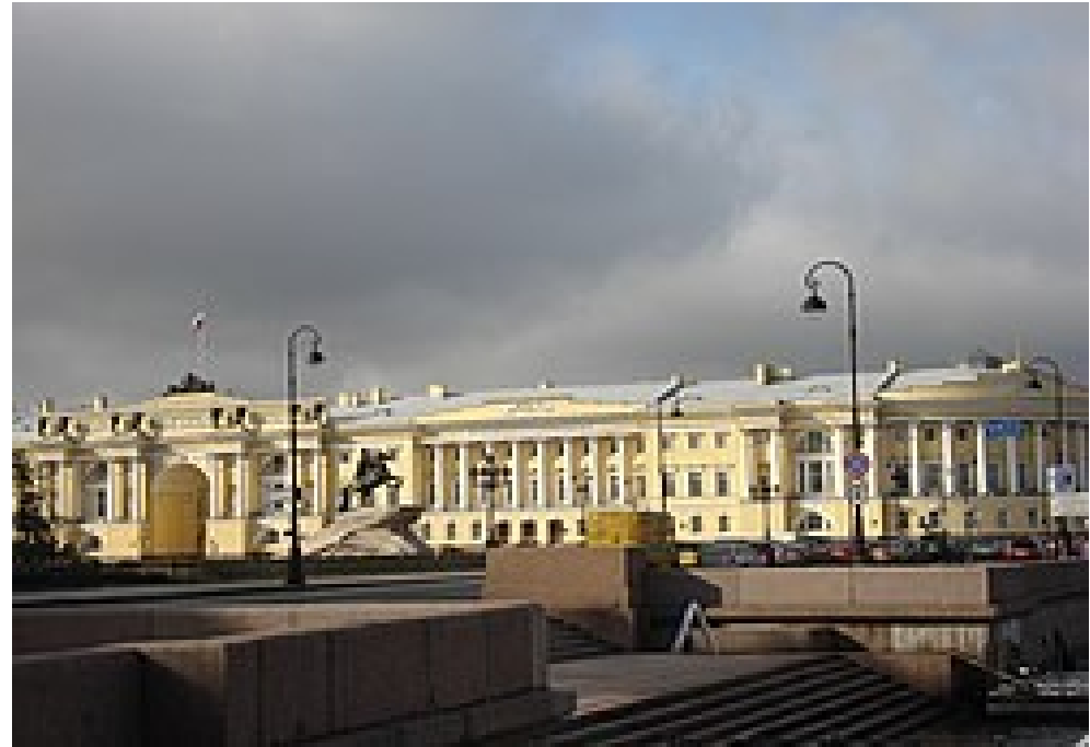
Здание Сената и Синода в Петербурге

В лице нового императора декабристы столкнулись с решительным и жёстким гвардейским полковником. Великий князь Николай Павлович не был ни слабой женщиной, ни прекраснодушным либералом. Будущий царь был заранее извещён об их планах и не хуже других гвардейских офицеров знал, как следует расправляться с бунтовщиками.