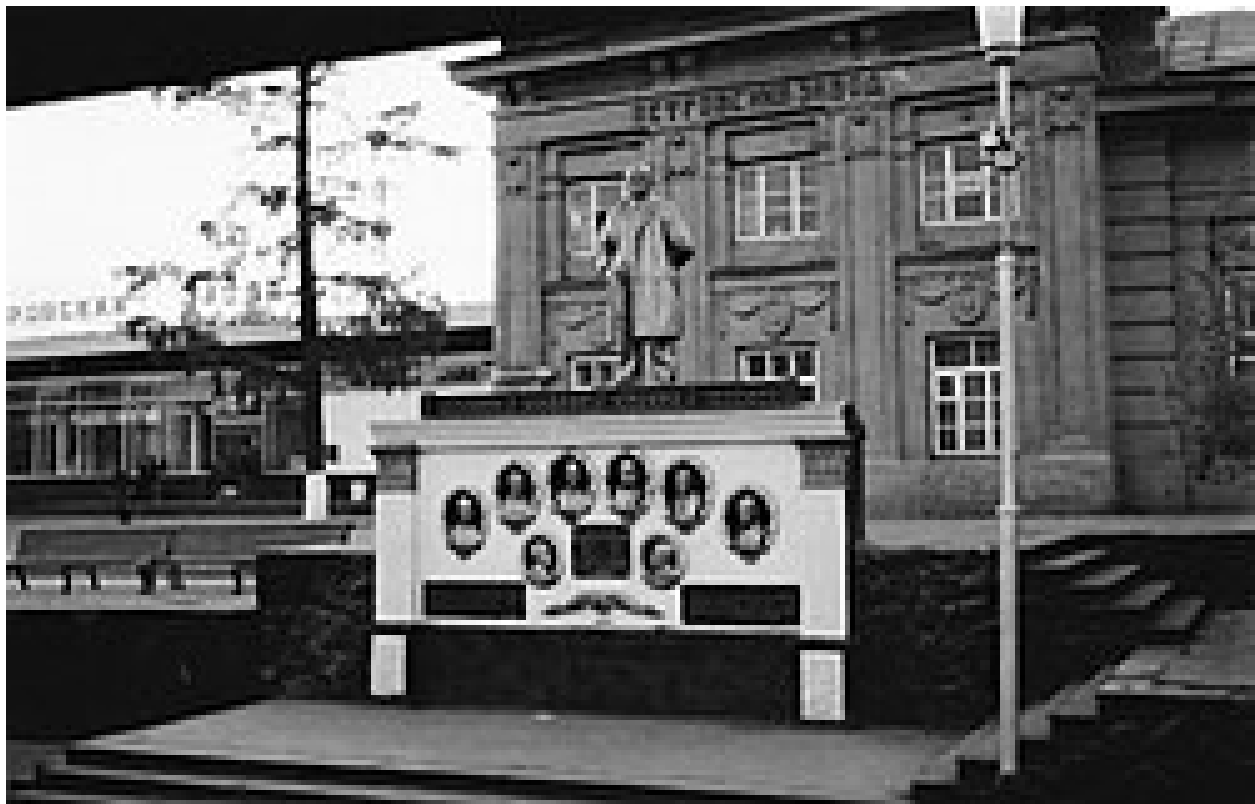
Памятник Ленину и памятник декабристам на станции Петровский Завод (город Петровск-Забайкальский), фото 1980 года.