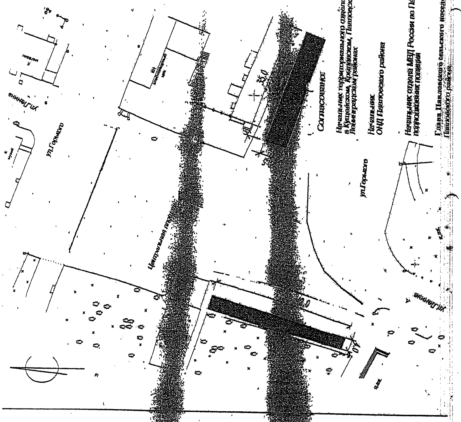
Схема размещения торговых мест в Павловском районе ст. Павловской по ул. Ленина (центральная площадь) для проведения новогодней ярмарки (количество торговых мест - 12)