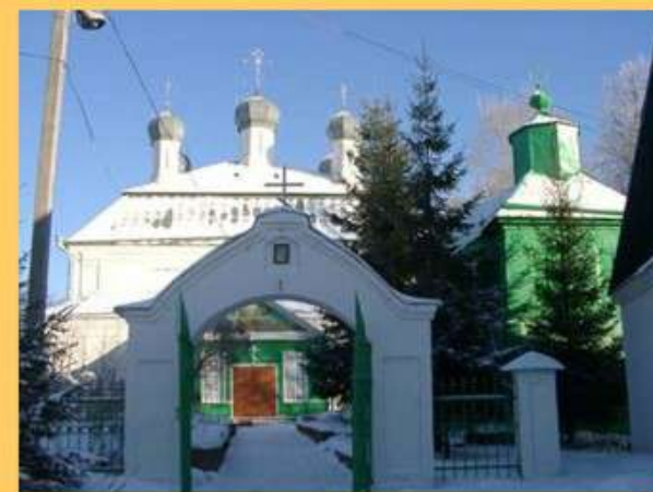
Спасо – Преображенская церковь погоста Влицы