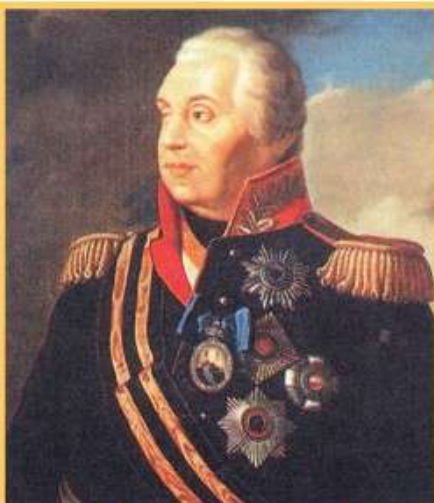
Михаил Илларионович Кутузов (1747 – 1813)