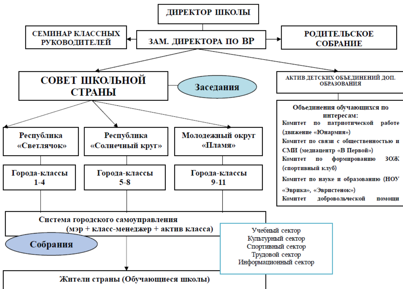
Структура ученического самоуправления «Школьная страна»