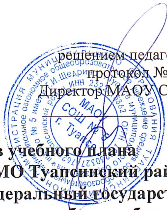
Таблица – сетка часов учебного плана МАОУ СОШ № 5 г. Туапсе МО Туапсинский район для 2-4 классов, реализующий федеральный государственный образовательный стандарт начального общего образования на 2022 – 2023 учебный год