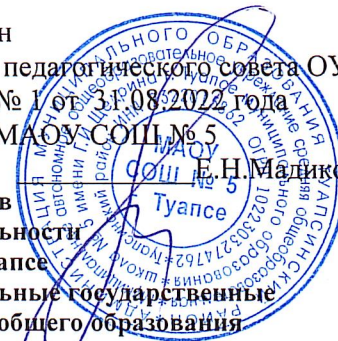
Таблица-сетка часов плана внеурочной деятельности МАОУ СОШ № 5 г.Туапсе для 6-9 -х классов, реализующих федеральные государственные образовательные стандарт основного общего образования в 2022 – 2023 учебном году