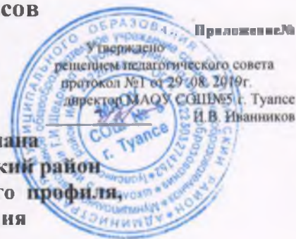
Таблица – сетка часов учебного плана MAOU СОШ №5 г. Туапсе МО Туапсинский район для 10 «А» класса социально – экономического профиля, по ФГОС среднего общего образования на 2019-2020 учебный год