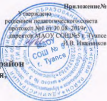
Таблица – сетка часов учебного плана МАОУ СОШ №5 г. Туапсе МО Туапсинский район для 10 «Б» класса универсального профиля, по ФГОС среднего общего образования на 2019-2020 учебный год