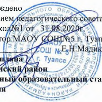
Таблица – сетка часов учебного плана МАОУ СОШ № 5 г. Туапсе МО Туапсинский район для 6-9 классов, реализующий федеральный государственный образовательный стандарт основного общего образования 2020 – 2021 учебный год