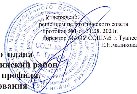
Таблица – сетка часов учебного плана MAOU SOSh №5 г. Туапсе МО Туапсинский район для 10 «Б» класса универсального профиля по ФГОС среднего общего образования на 2021-2022 учебный год