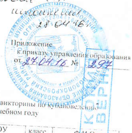
Список победителей и призеров викторины по кубановедению в 2015-2016 учебном году