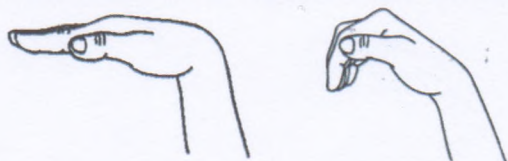
Рис. а, б

На счет «один» согнуть пальцы в нижних и средних фалангах, опустить кончики пальцев вниз (рис. 15, б). На счет «два» — вернуть пальцы и кисть в исходное положение, удерживать под счет от 1 до 5. Выполнять упражнение 6—7 раз.