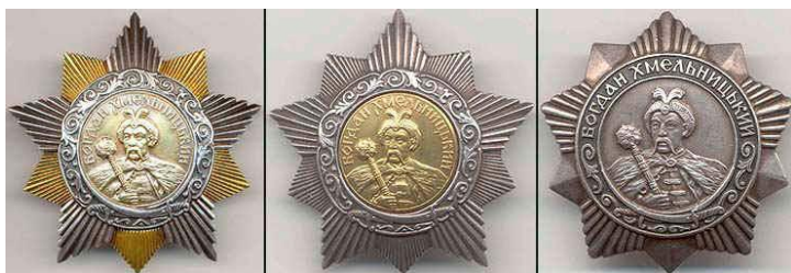
Орден Богдана Хмельницкого трех степеней

Орденом Богдана Хмельницкого II степени награждаются командиры корпусов, дивизий, бригад и полков, их заместители, начальники штабов, командиры соединений партизанских отрядов, их заместители и начальники штабов, командиры партизанских отрядов: