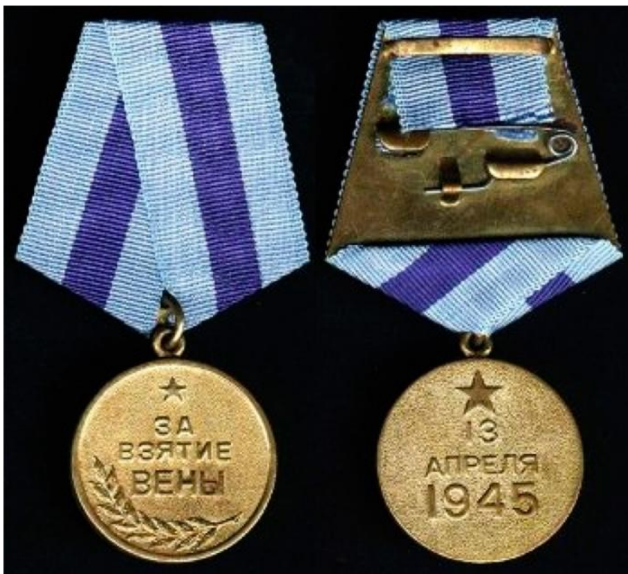
Медаль «За взятие Вены»

Медаль “За взятие Вены” носится на левой стороне груди и при наличии других медалей СССР располагается после медали “За взятие Кенигсберга”.