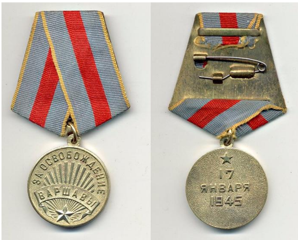
Медаль «За освобождение Варшавы»

Автор проекта медали — художница Курицына.