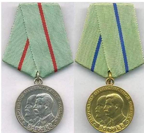
Медаль «Партизану Отечественной войны»

Медалью “Партизану Отечественной войны” I степени награждались партизаны, начальствующий состав партизанских отрядов и организаторы партизанского движения за особые заслуги в деле организации партизанского движения, за отвагу, геройство и выдающиеся успехи в партизанской борьбе за нашу Советскую Родину в тылу немецко-фашистских захватчиков.