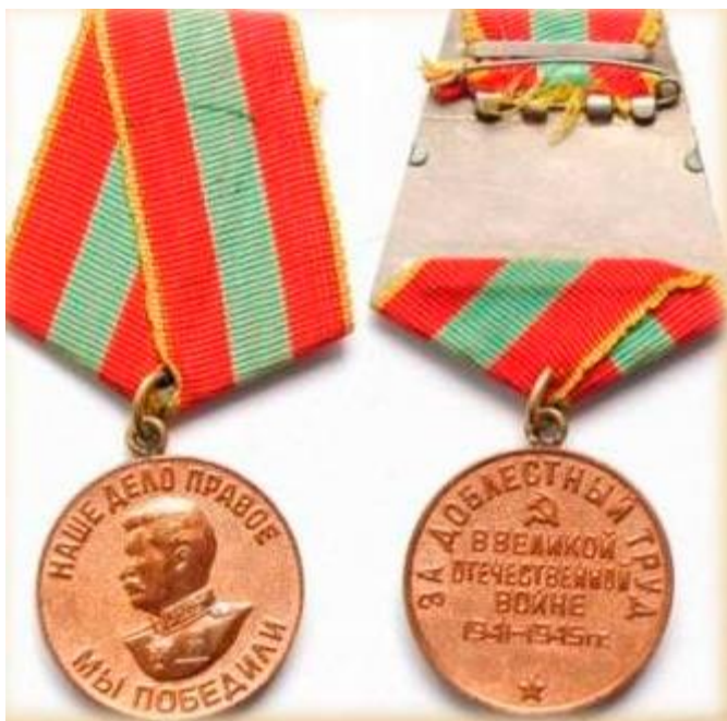
Медаль «За доблестный труд в Великой Отечественной войне 1941-1945 гг.»

Всего медалью “За доблестный труд в Великой Отечественной войне 1941-1945 гг.” награждено около 16 млн. 100 тыс. человек.