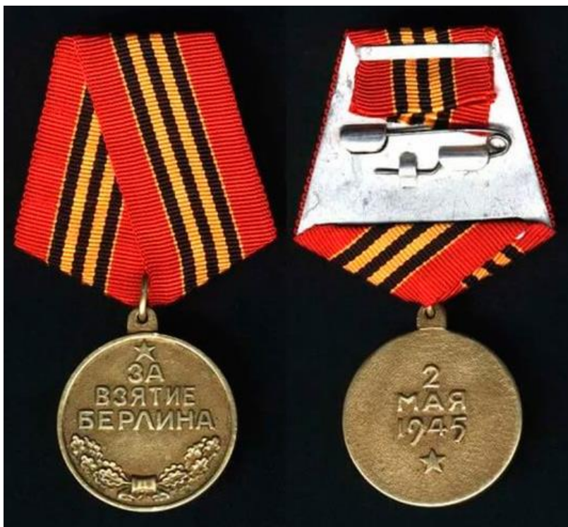
Медаль «За взятие Берлина»

Носится на левой стороне груди и при наличии других медалей СССР располагается после медали “За взятие Вены”.