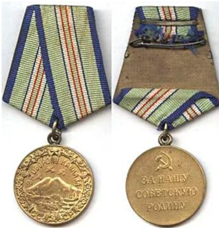
Медаль «За оборону Кавказа»

В исключительных случаях могло быть произведено повторное награждение медалью.