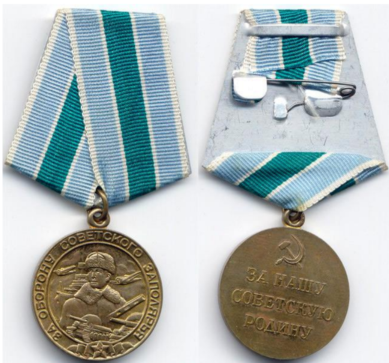
Медаль «За оборону Советского Заполярья»

Идея учреждения медали принадлежит работникам разведотдела штаба Карельского фронта. Было сделано несколько эскизов. Лучшим был признан рисунок, который представил подполковник В. Алов. После поддержки идеи о создании медали Военным Советом фронта, рисунок отослали в Москву. Отдельные элементы в первоначальном рисунке Алова доработал художник Кузнецов А.И.