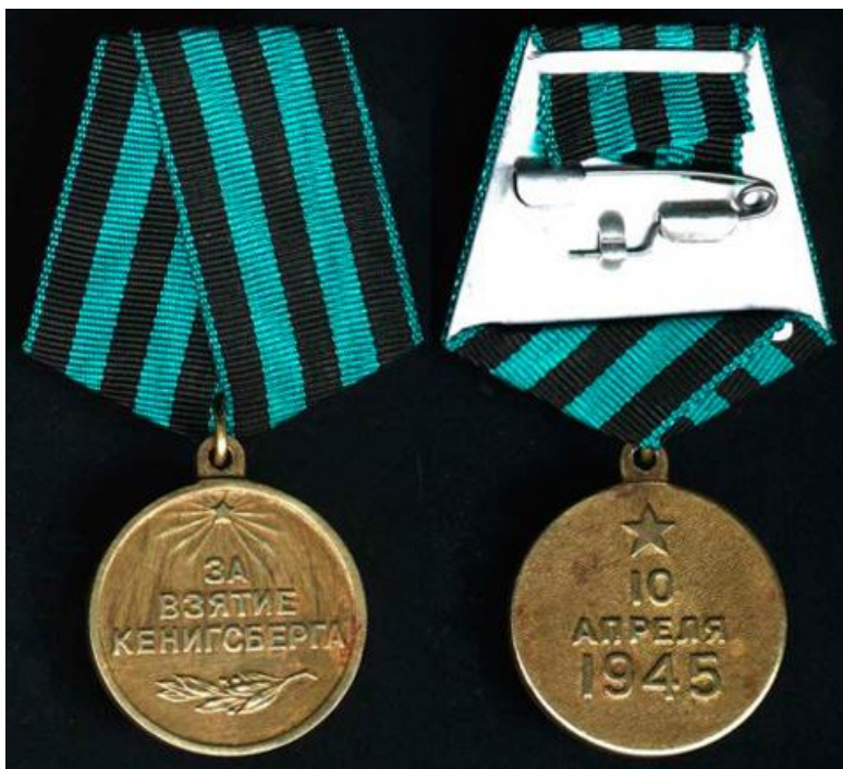
Медаль «За взятие Кенигсберга»

Носится на левой стороне груди и при наличии других медалей СССР располагается после медали “За взятие Будапешта”.