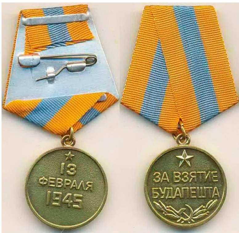
Медаль «За взятие Будапешта»

Носится на левой стороне груди и при наличии других медалей СССР располагается после медали “За победу над Японией”.