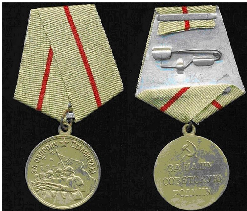
Медаль «За оборону Сталинграда»

Носится на левой стороне груди и при наличии других медалей СССР располагается после медали «За оборону Севастополя».