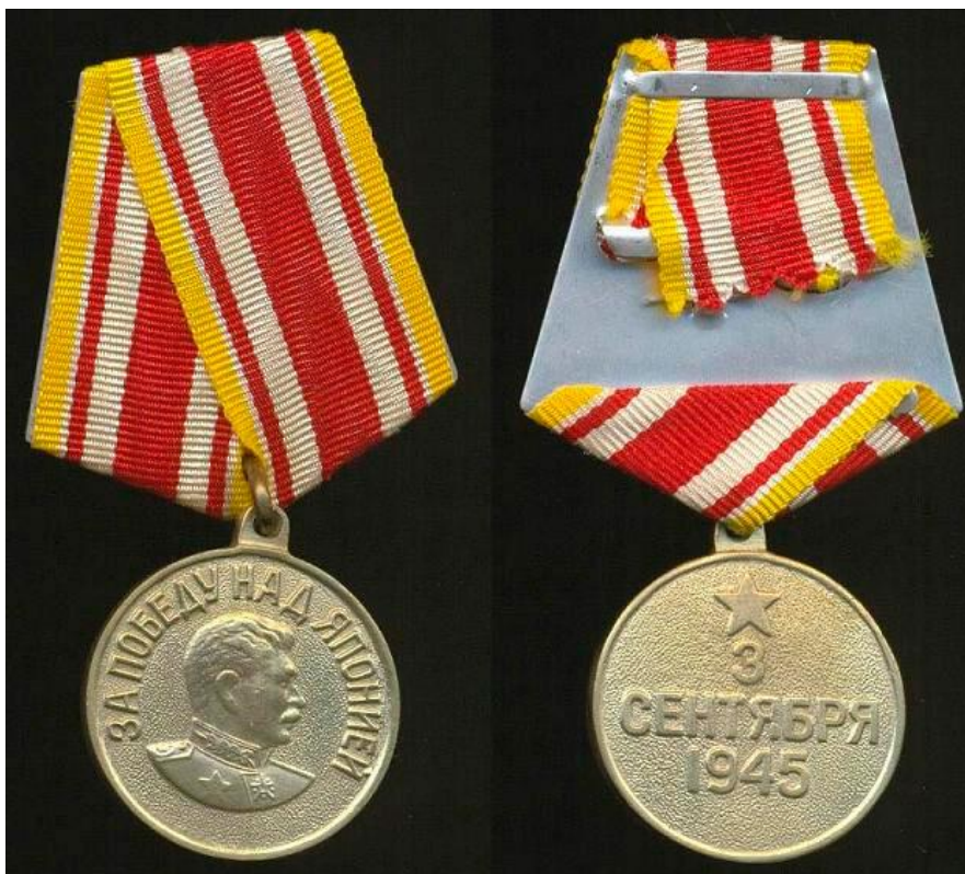
Медаль «За победу над Японией»

Вручение медали “За победу над Японией” производится от имени Президиума Верховного Совета СССР на основании документов, подтверждающих участие в боевых действиях против Японии, выдаваемых командирами войсковых частей и начальниками военно-лечебных заведений.