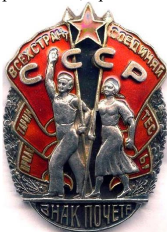
Орден «Знак почета»

Награждению подлежали: граждане СССР; предприятия, объединения, учреждения, организации, районы, города и другие населенные пункты; а также: лица, не являющиеся гражданами СССР, а также предприятия, учреждения, организации, населенные пункты иностранных государств.