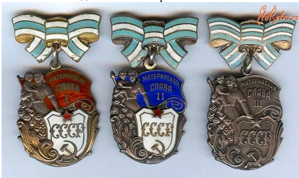
Орден “Материнская слава”

Награждение орденом соответствующей степени производится при достижении последним ребенком возраста одного года и при наличии в живых остальных детей этой матери.