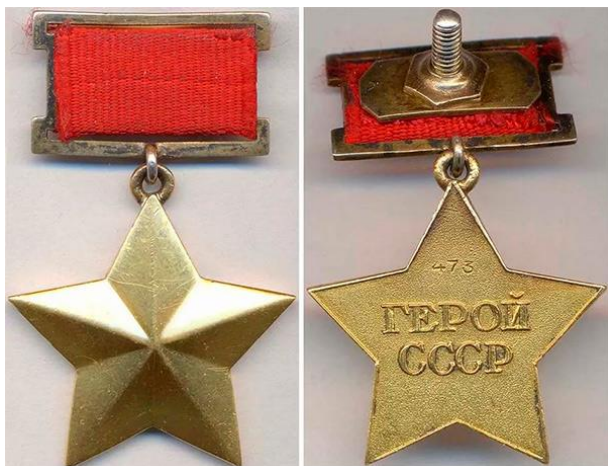
Медаль «Золотая Звезда»

подъему народного хозяйства, науки, культуры, росту могущества и славы СССР.