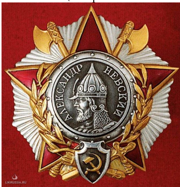
Орден Александра Невского

Орден Александра Невского является младшим из «полководческих» орденов. Он единственный среди них, имеющий только одну степень. Многие коллекционеры считают его самым красивым из орденов СССР.