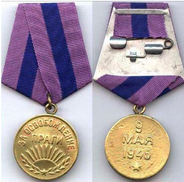
Медаль «За освобождение Праги»

Указом Президиума Верховного Совета СССР от 5 февраля 1951 года установлено, что медаль “За освобождение Праги” и удостоверение к ней в случае смерти награжденного остаются в его семье для хранения как память. До появления данного Указа сама медаль и удостоверение к ней после смерти награжденного возвращались государству.