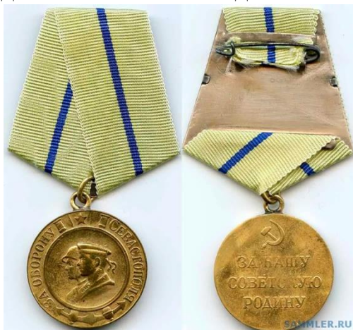
Медаль «За оборону Севастополя»

Награждению подлежали все участники обороны Севастополя — военнослужащие Красной Армии, Военно-Морского Флота и войск НКВД, а также лица из гражданского населения, принимавшие непосредственное участие в обороне. Периодом обороны Севастополя считается 5 ноября 1941 года — 4 июля 1942 года.