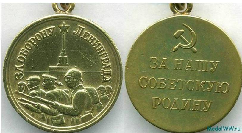
Медаль «За оборону Ленинграда»

Носится на левой стороне груди и при наличии других медалей СССР располагается после медали “За спасение утопающих”.