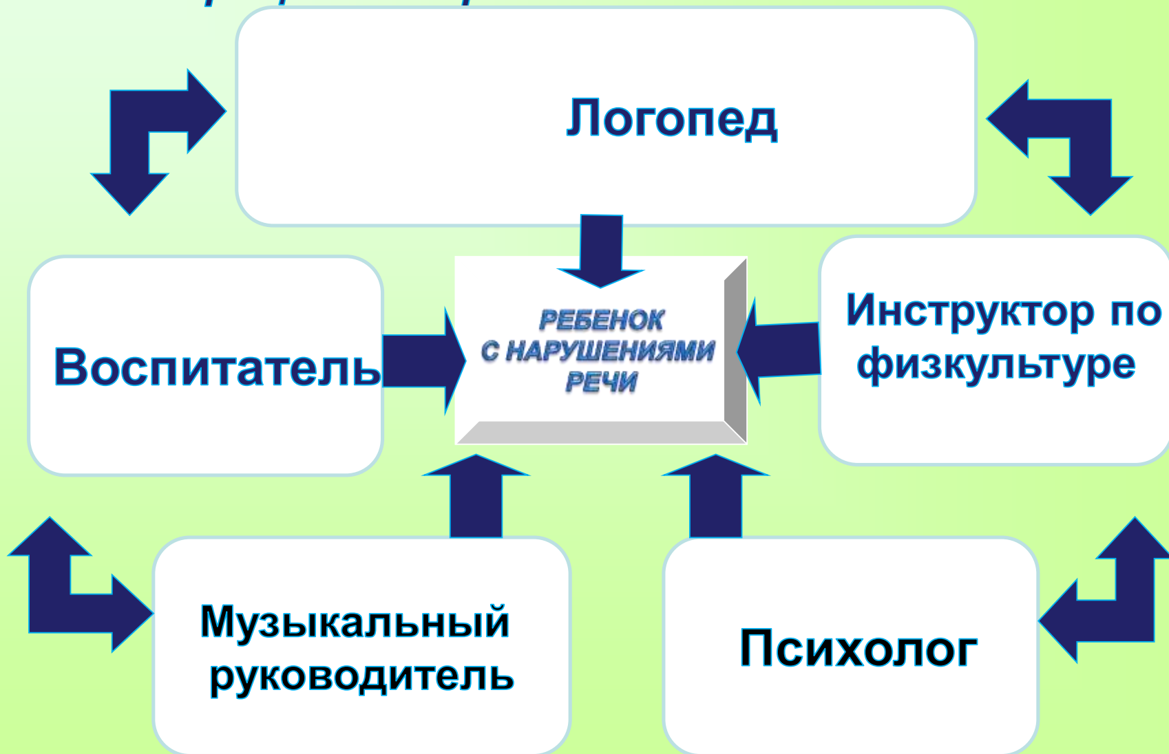
Схема взаимодействия участников коррекционного процесса в проектной деятельности