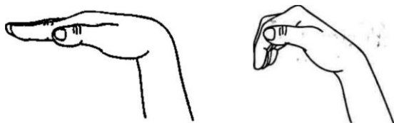
Рис. а, б

На счет «один» согнуть пальцы в нижних и средних фалангах, опустить кончики пальцев вниз (рис. 15, б). На счет «два» — вернуть пальцы и кисть в исходное положение, удерживать под счет от 1 до 5. Выполнять упражнение 6—7 раз.