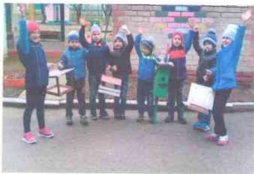
Экологическая акция «Кормушка своими руками»