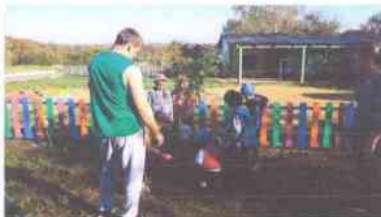
Экологическая акция «Посади дерево»