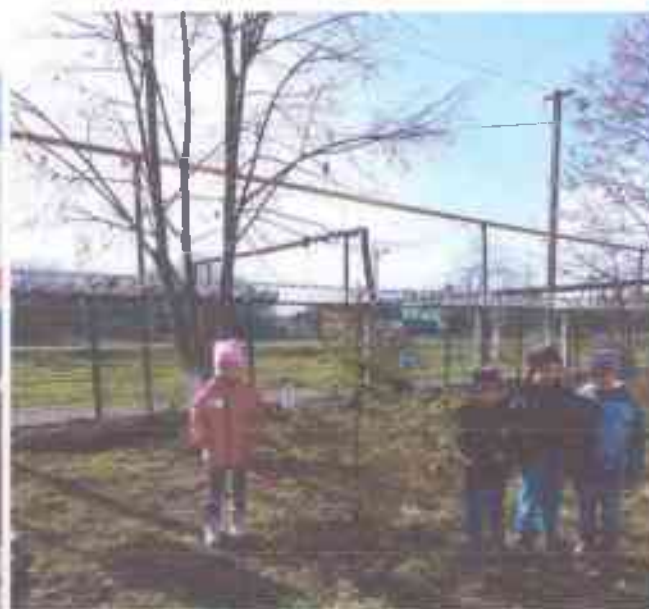
Экологическая акция «Защитим елочку — красавицу наших лесов!»