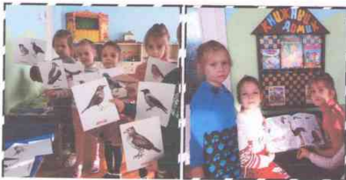
Тематическое занятие «Птицы нашего края»