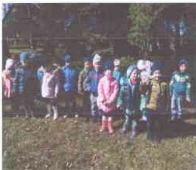
Экскурсия в весенний лес