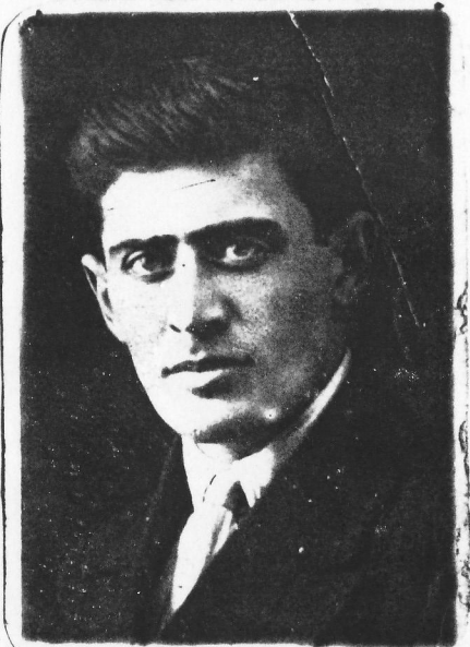
1937 год . г. Краснодар, сельхозинститут.