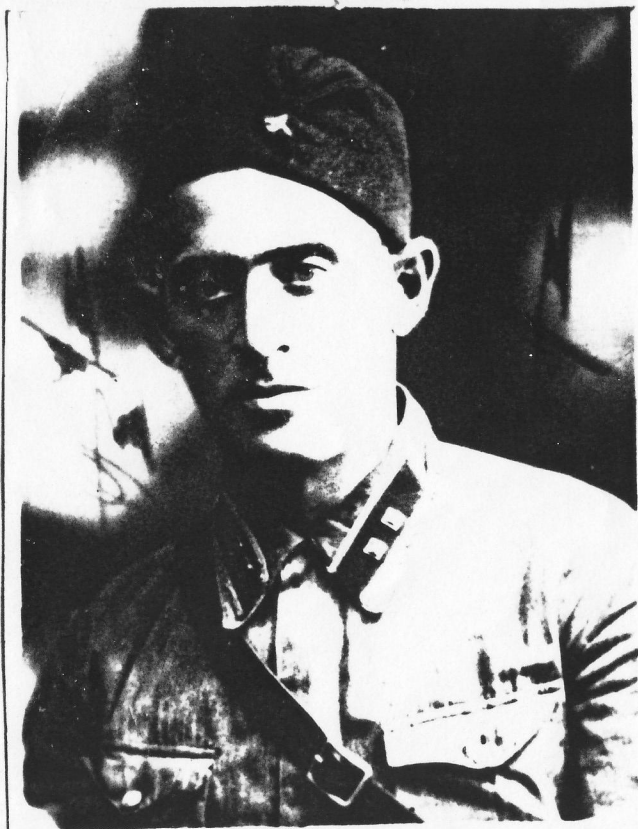
1941 год. В рядах Красной Армии.