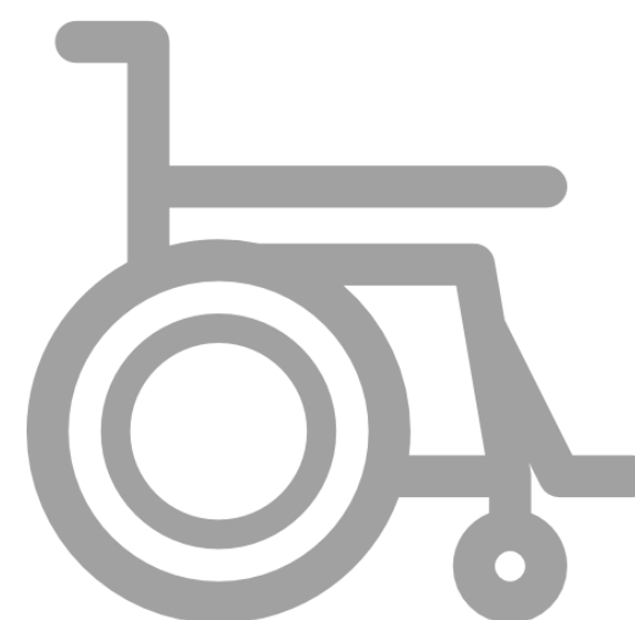
специальные технические средства