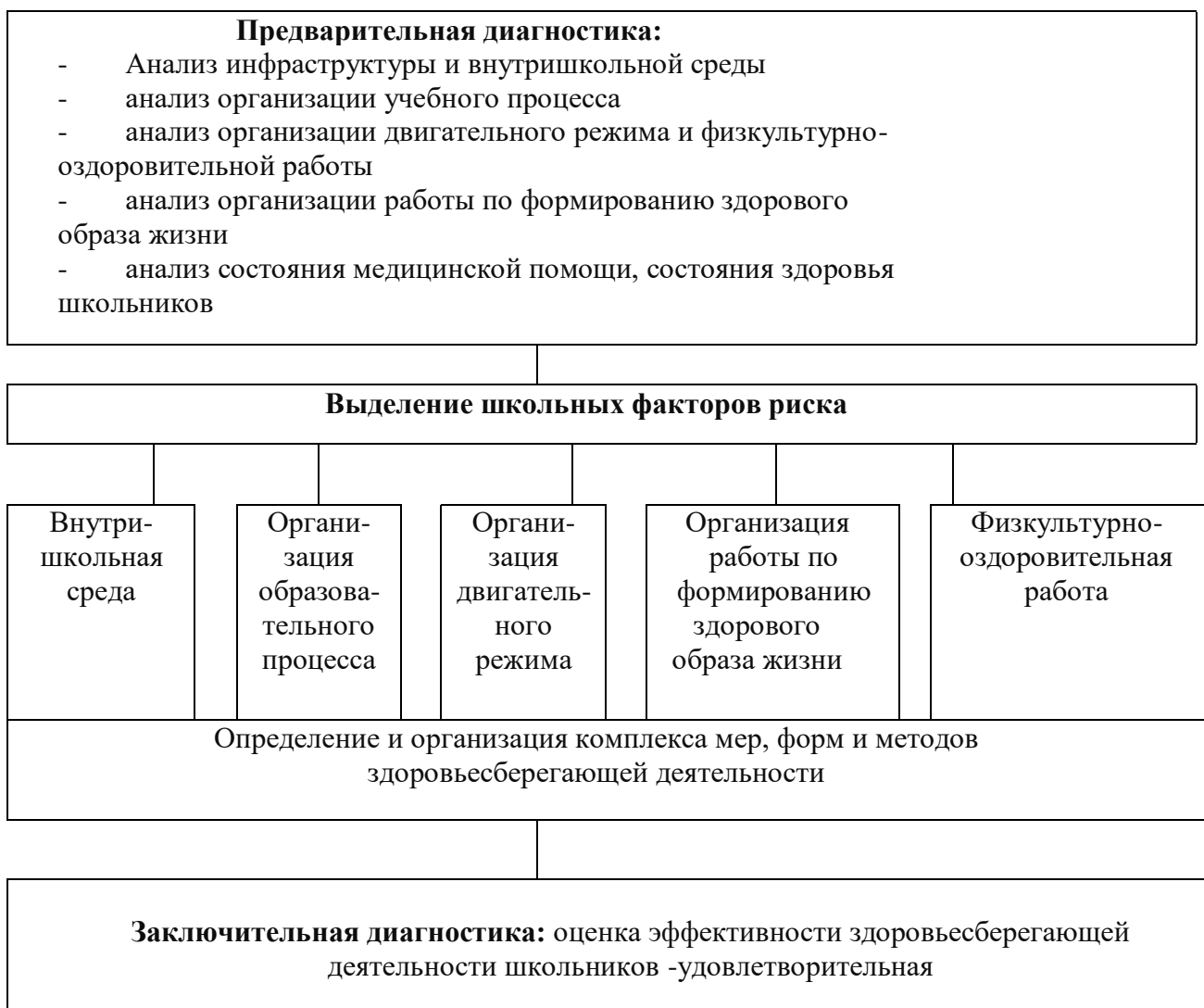
Схема реализации программы