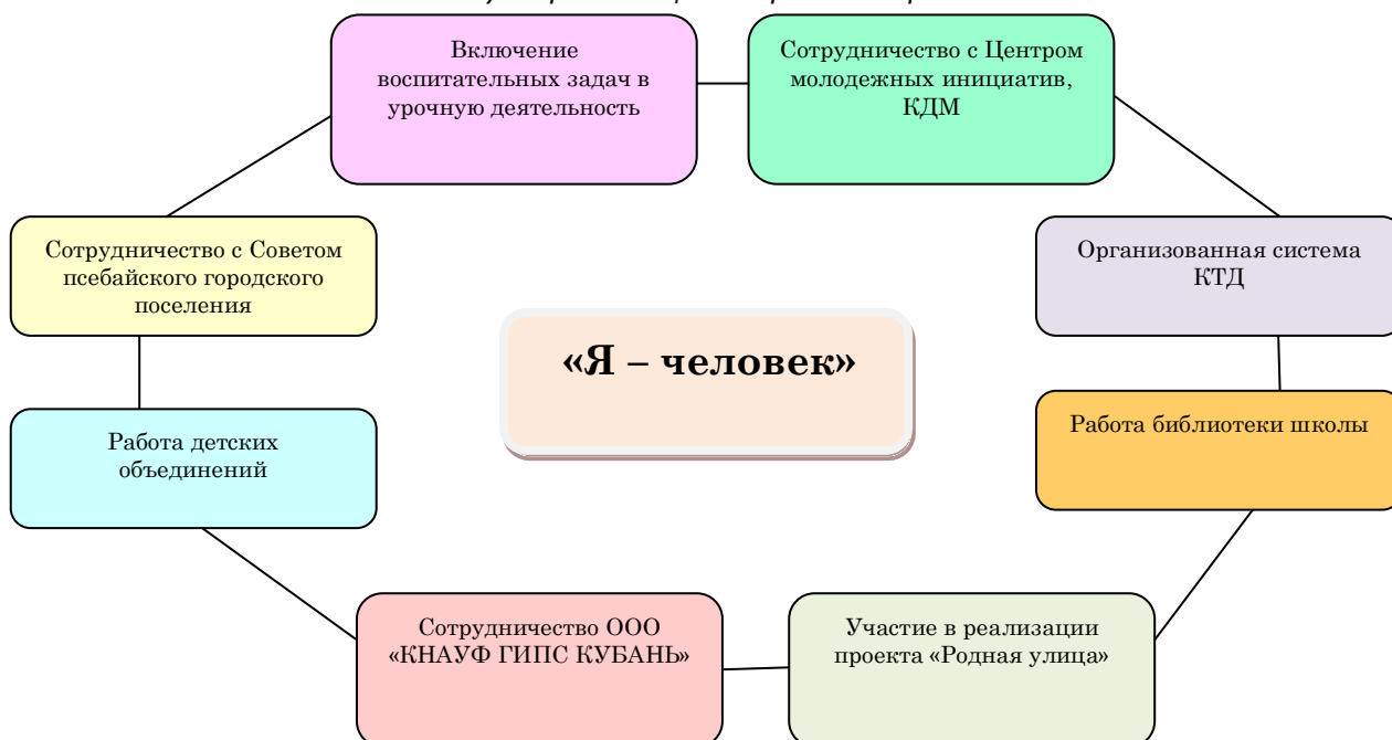
Пути реализации направления работы «Я – человек»

Этапы включения обучающихся в сферу общественной самоорганизации могут выстраиваться в логике технологии коллективно-творческой деятельности: поиск объектов общей заботы, коллективное целеполагание, коллективное планирование, коллективная подготовка мероприятия, коллективное проведение, коллективный анализ.