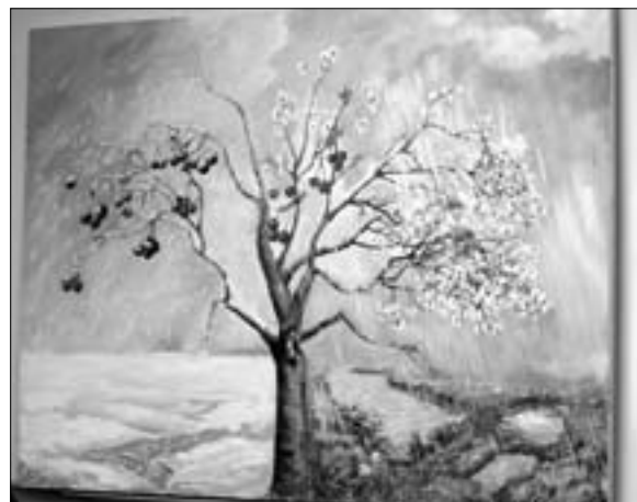
Общественные организации «Физкульт» и «Инвастудия» подготовили картину «Зимняя вишня - цветы», ее скоро передадут в Кемерово.