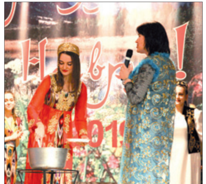
Особенности и местные технологии приготовления блюд национальной кухни Таджикистана делают ее неповторимой и узнаваемой. Девушки с удовольствием приняли участие в конкурсе под названием «Кулинария».