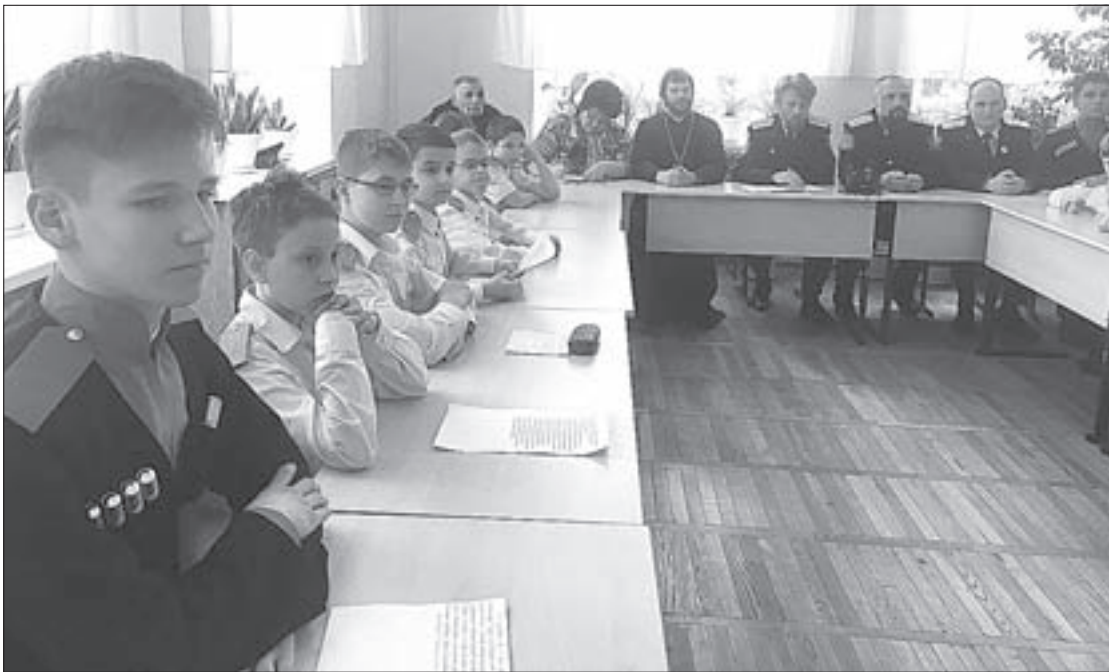
Информация о том, что в школе у казачат появится свой штаб, очень понравилась ребятам.