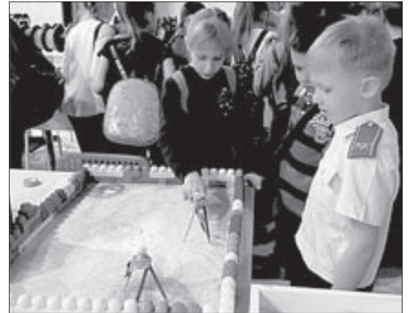
Ребята получили на фестивале немало ярких эмоций.

4 апреля юные казаки из 3-го Б класса краснодарской средней школы №65 вместе со своим казачком-наставником посетили фестиваль робототехники.