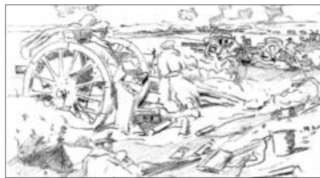
Артиллерийская батарея в бою. 1915-1916 гг.