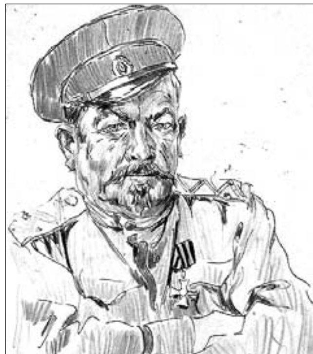
Портрет генерала Лавра Корнилова, 1915 год. Перо, тушь, цветные карандаши.