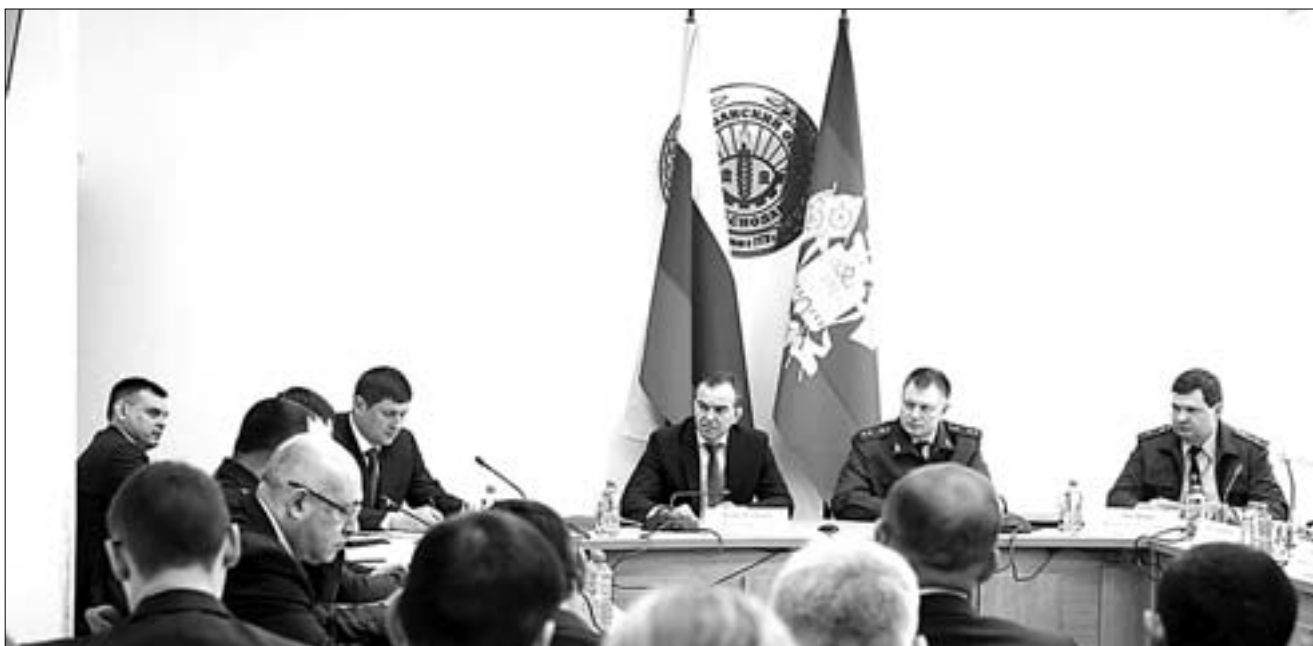
В планах у властей на этот год - достроить и ввести в эксплуатацию 14 проблемных объектов в Краснодаре.