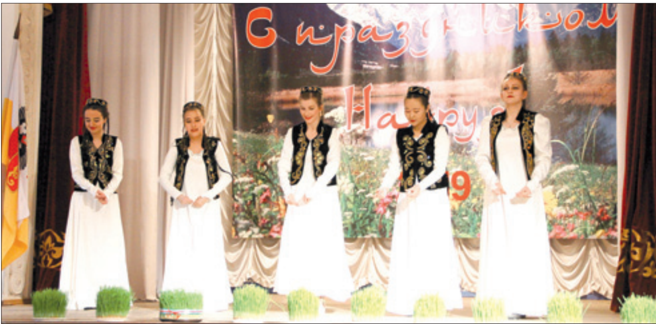
В Краснодаре отпраздновали приход весны. С богатыми столами, с песнями, танцами и национальными играми - как и должно быть на Навруз.