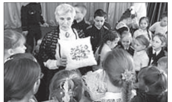
Это было настоящее погружение в старину.

3 апреля в поселке Белозерном прошла выставка убранств XIX века, организаторами которой стали казаки ХКО имени Святого Георгия и поселковый Дом культуры.