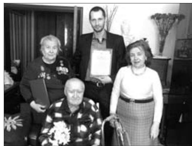
Поколение победителей - наша гордость и неизменный пример для подражания. Именно эти слова были сказаны юбиляру.