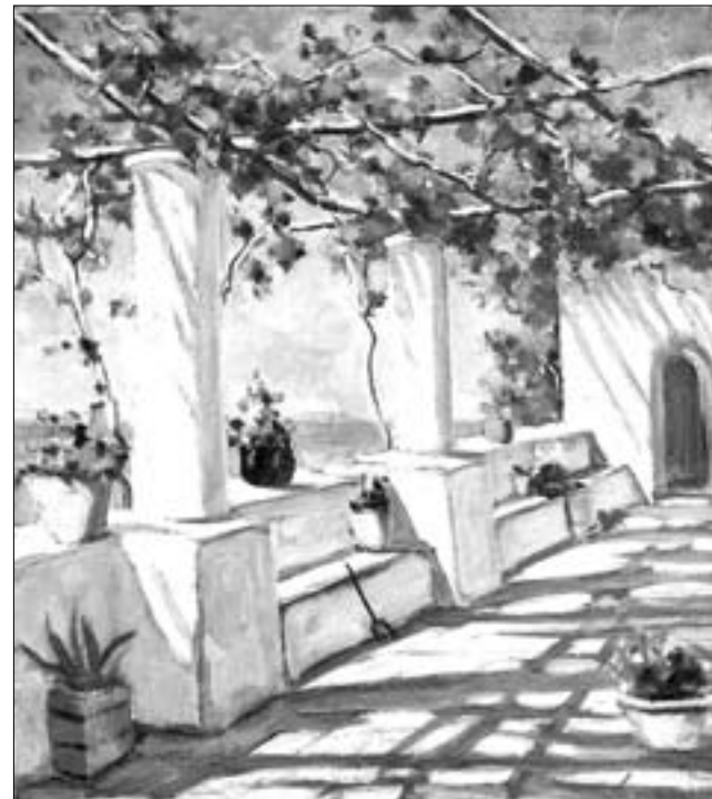
Капри. Масло, тушь, перо.

После смерти художника его дочь передала в СССР три серии его картин: «Город Ейск» (151 работа), «Мировая война 1914-1917» (113 работ), «Алтай и Сибирь» (83 работы). Часть этой коллекции хранится в Государственном музее изобразительных искусств им. А.С. Пушкина в Москве, часть - в Русском музее Санкт-Петербурга.