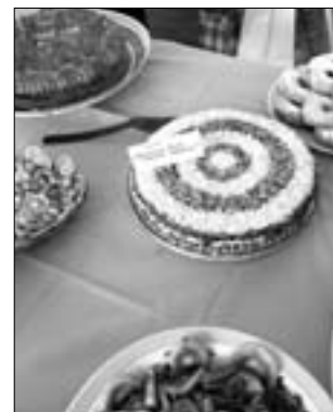
Участники клуба рассказали о своих оригинальных рецептах и поделились полезными советами.