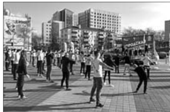
300 человек собираются на Театральной площади и с удовольствием выполняют упражнения.

Общегородская «#Зарядка_РФ» на Театральной площади проходит раз в месяц с августа 2018 года и собирает более 300 участников.