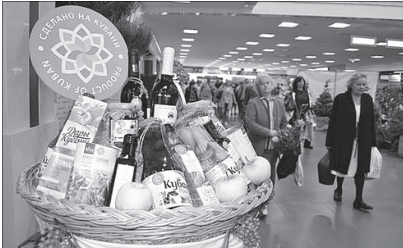
● Уже многие знают: кубанские продукты - самые вкусные. Но чтобы так называться, они тоже должны пройти «экзамены».