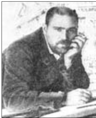
Леонид Романович Сологуб в годы Первой мировой.

Дата. 16 апреля исполнится 135 лет со дня рождения Леонида Сологуба (1884-1956) - живописца, графика, сценографа, архитектора