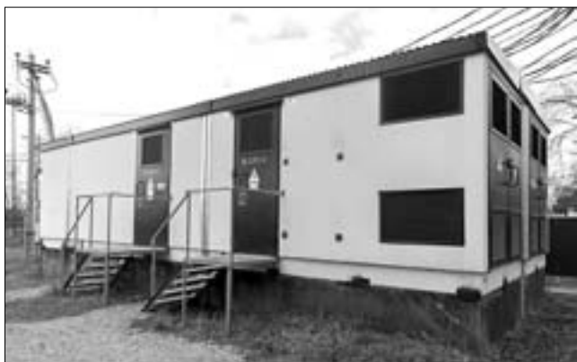
К концу апреля распределительный пункт переподключат от подстанции, и 3000 жителей пригорода забудут о переboях с электричеством.