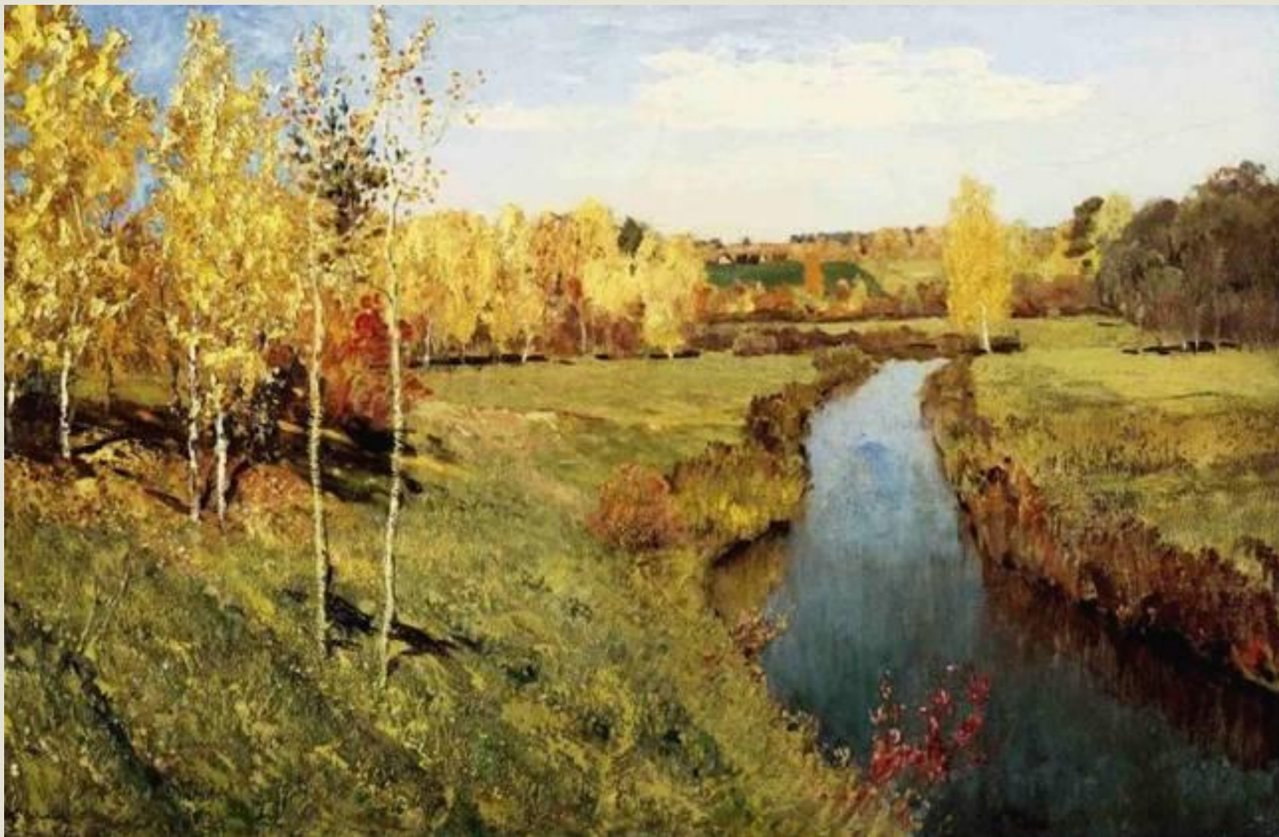
Золотая осень. 1895год