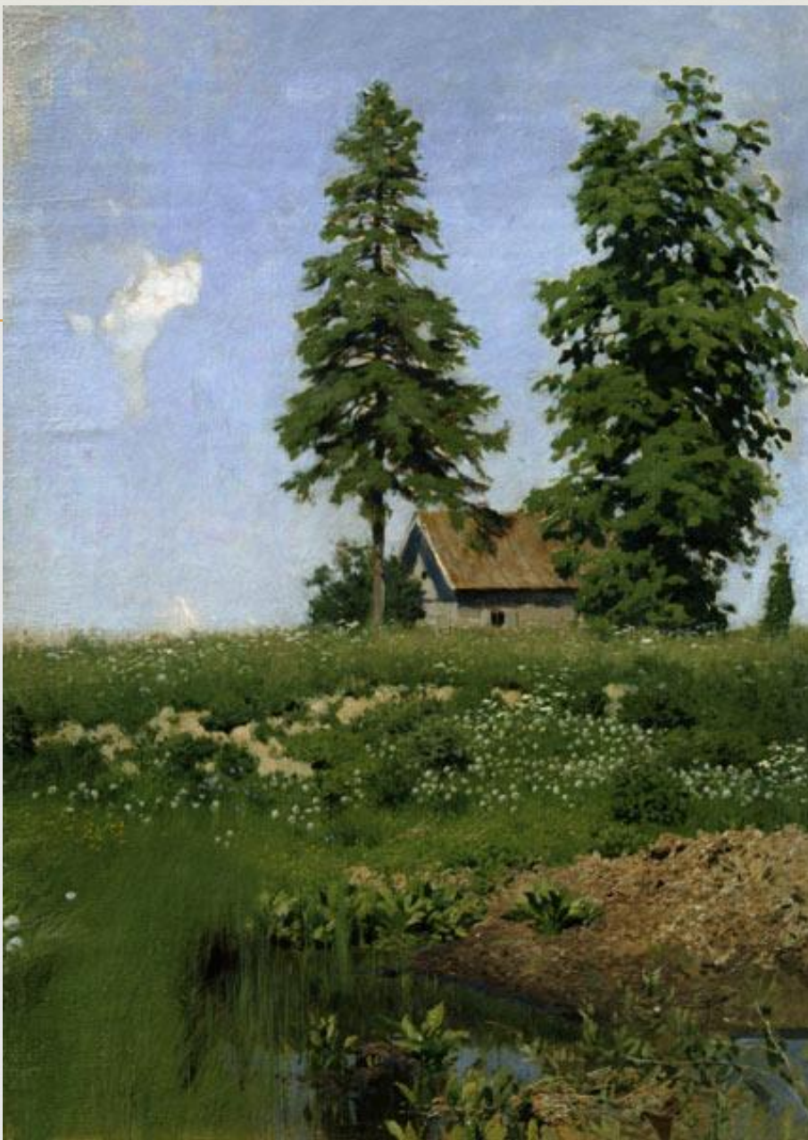
И.И.Левитан «Избушка на лугу»