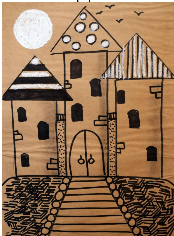
Приложение № 6