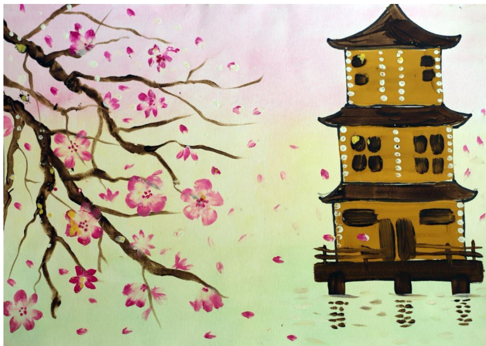
Приложение № 5