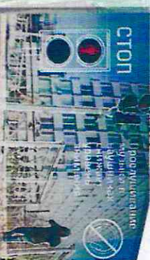
Правило №5 Не переходи железнодорожную дорогу на красный свет!

Правила эти железнодорожные - Строгие очини, но пове не сложишь. Ты их запомни всегда внимательно, В жизни помогут они обязательно!