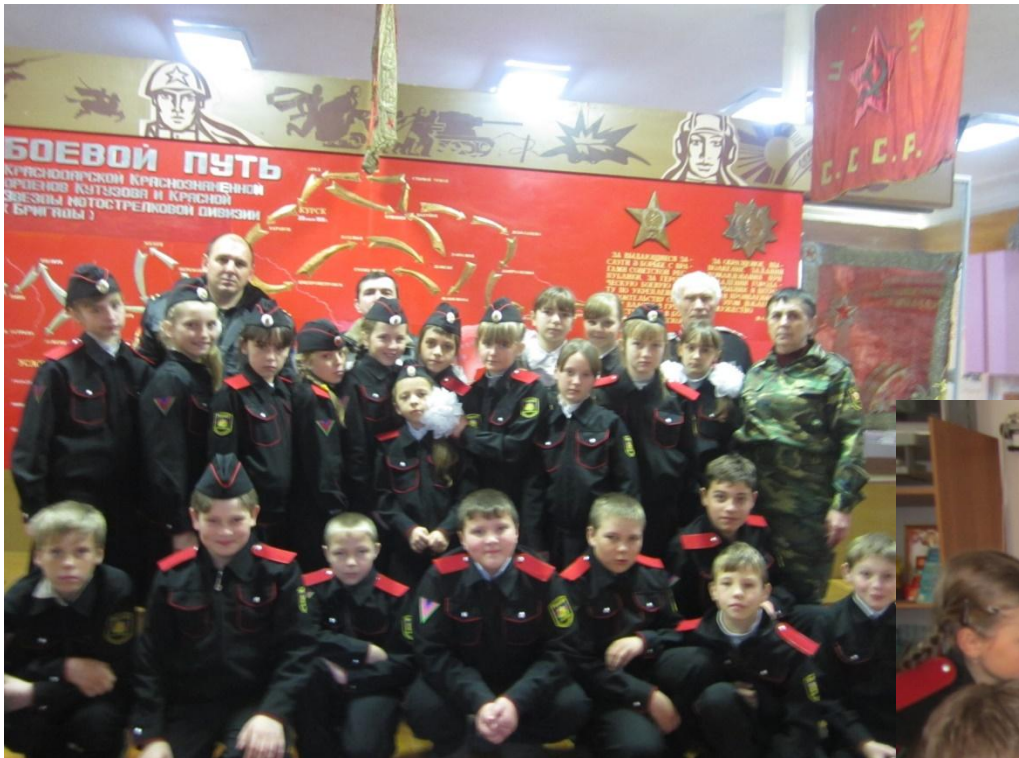
Экскурсия в мотострелковую воинскую часть г. Майкопа РА