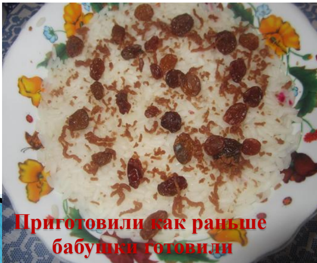
Приготовили как раньше бабушки готовили