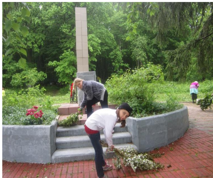
На месте трагедии