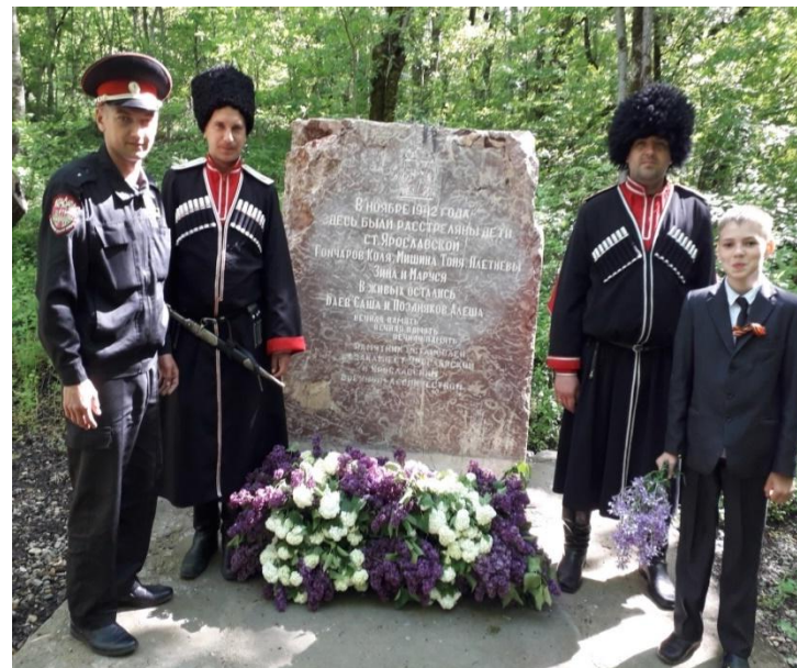
Возложение гирлянды к новому памятнику