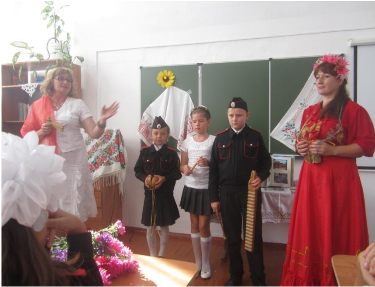
Встреча с фольклорным ансамблем «Истоки»