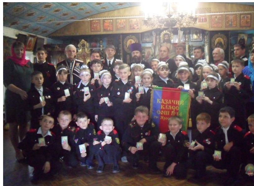
Принятие новых казачат