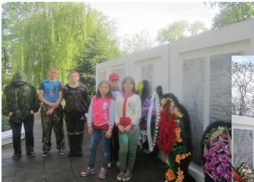
Место захоронения погибших на Михизеевой поляне