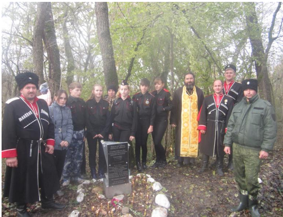
Молебен в урочище Султанка