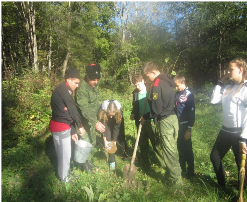
Посадка аллеи на Михизеевой Поляне