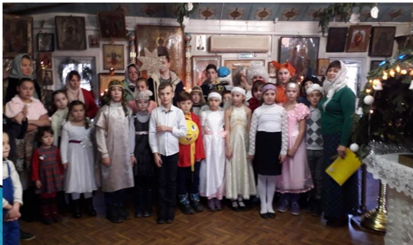
Участие казачат в рождественской елки в станичном храме