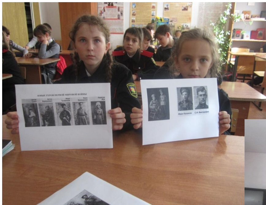
Казачи- герои Первой мировой войны