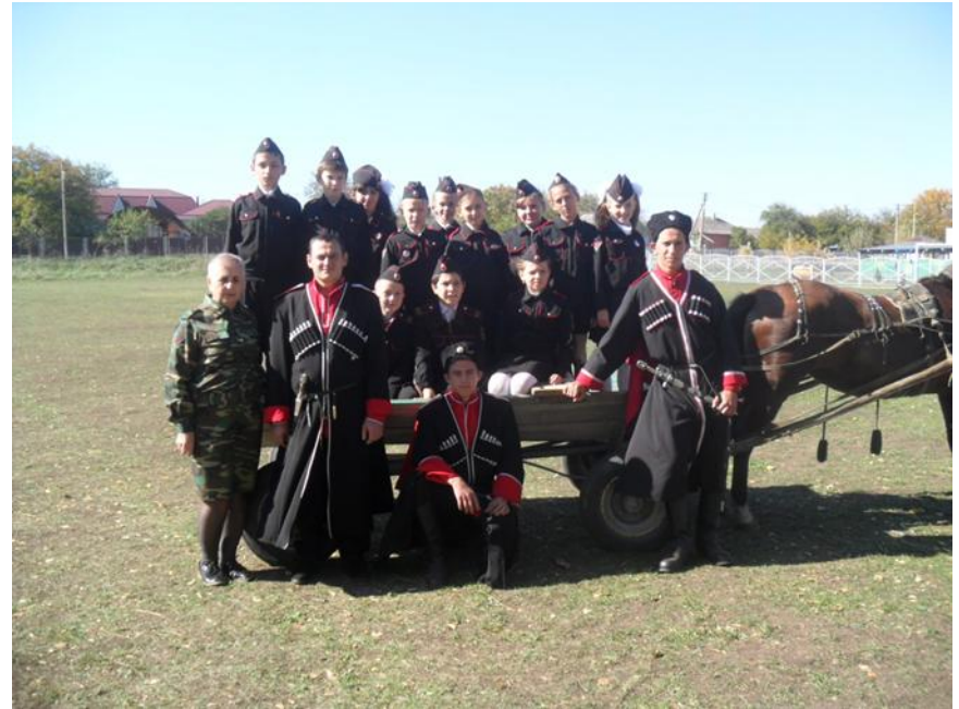
Казак без лошади - не казак