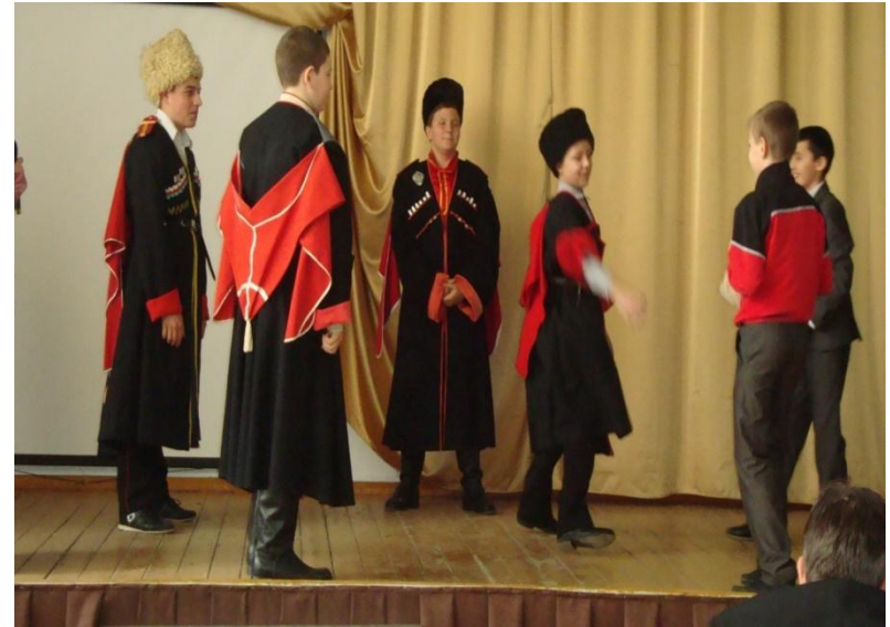
Возрождение казачьих игр