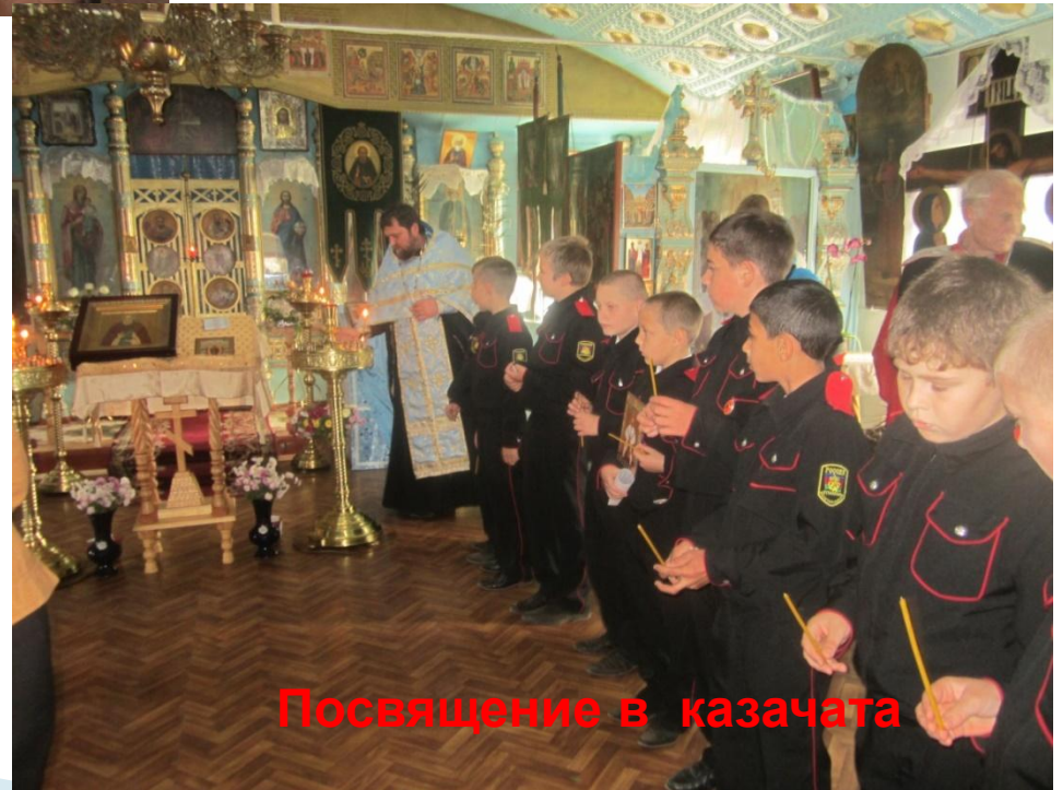
Посвящение в казачата