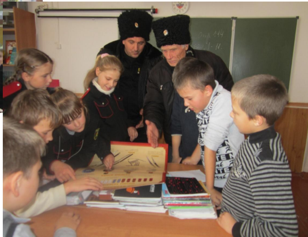
День наставника. Атаман и наставник знакомят юных казачат с казачьими званиями и чинами