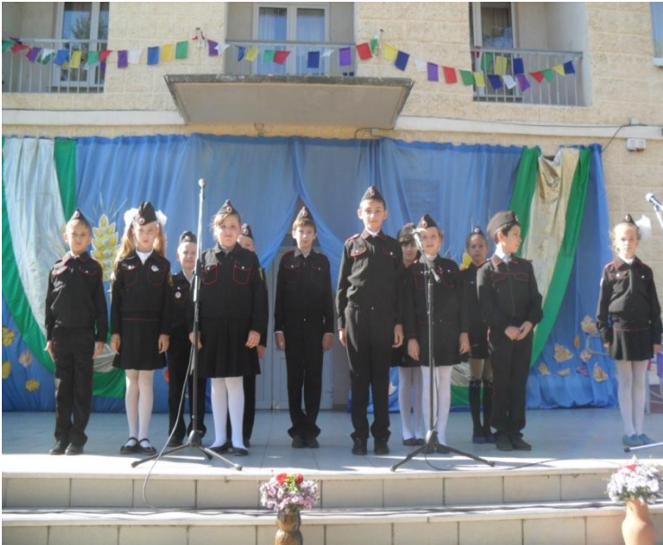
Участие в праздничном концерте