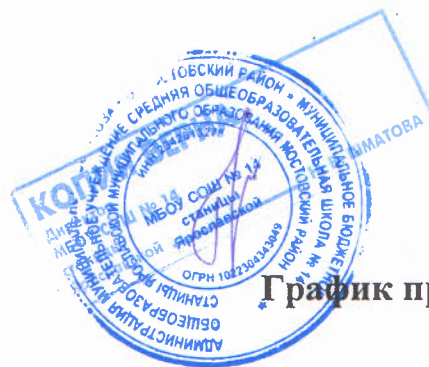
График проведения административных контрольных работ за I полугодие 2017-2018 учебного года