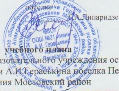
Таблица-сетка часов учебного плана

Муниципального бюджетного общеобразовательного учреждения основной общеобразовательной школы № 21 имени А.И.Гераськина поселка Перевалка муниципального образования Мостовский район