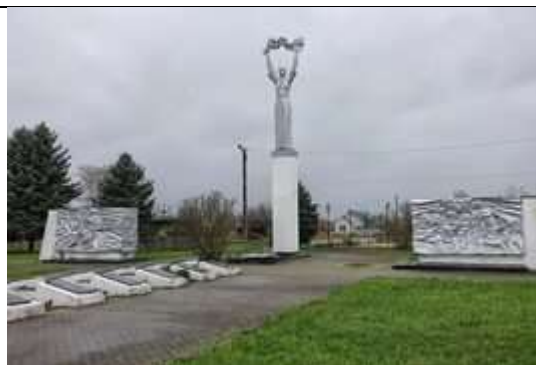
Памятный мемориал, в честь 45-летия Победы в годы Великой Отечественной войны