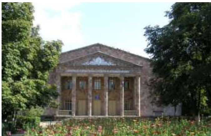
Здание колхоза «Путь к коммунизму» (построено в 1963 г.)