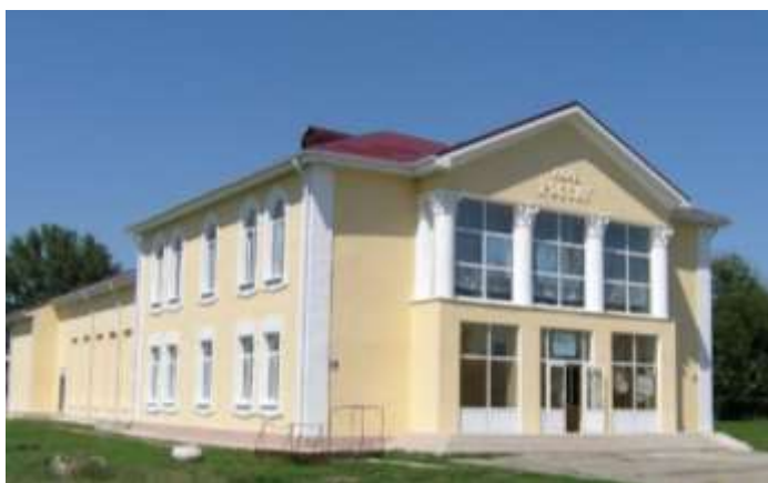
Здание СДК «Родина», построено в 1957 г.