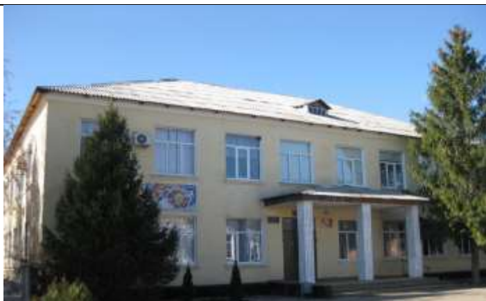
Здание МБОУ СОШ № 10, построено в 1964 г.