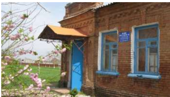
Здание школьного музея имени Г.Г. Степанова