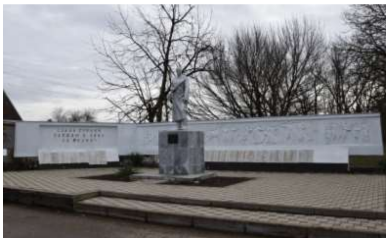
Памятник, погибшим бойцам в годы Великой Отечественной войны (17 мраморных плит с 446 фамилиями погибших и 4 плиты с 37 фамилиями пропавших без вести) (установлен в 1965 г.)