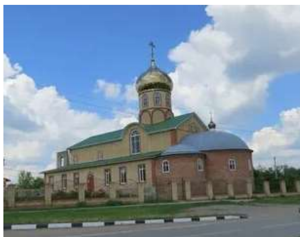
Церковь Николая Чудотворца (бывший Народный дом)