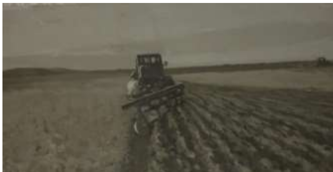
Стены здания украшены фресками.