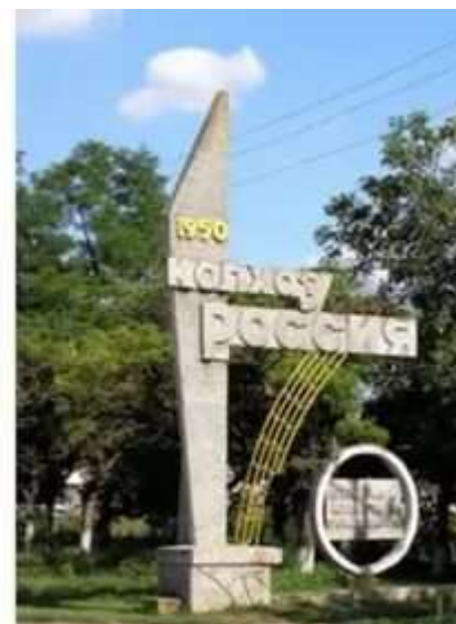
Мемориальная доска на здании правления колхоза «Россия». памятная стела перед мостом через р. Кирпили «Колхоз «Россия» 1950 г. (автор Губский Н.Н.)