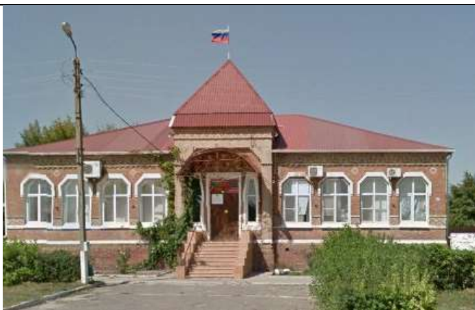
Здание администрации медведовского сельского поселения (женская школа для девочек из казачьих семей, начало строительства 1898 г.)