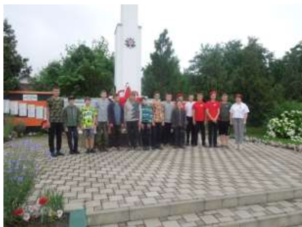
Фото у памятника