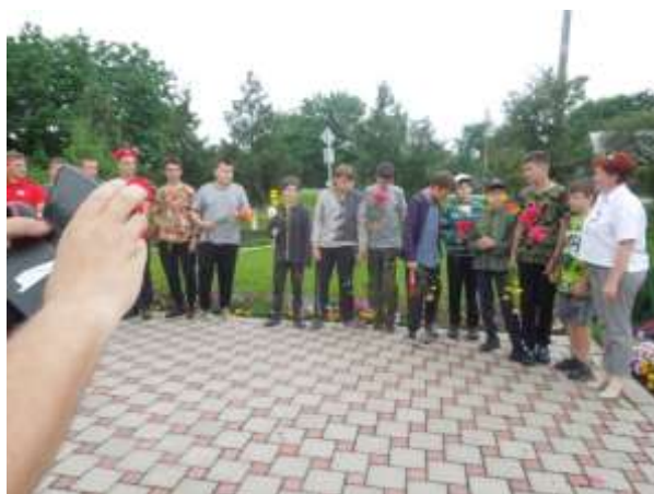
Напутственное слово главы поселения