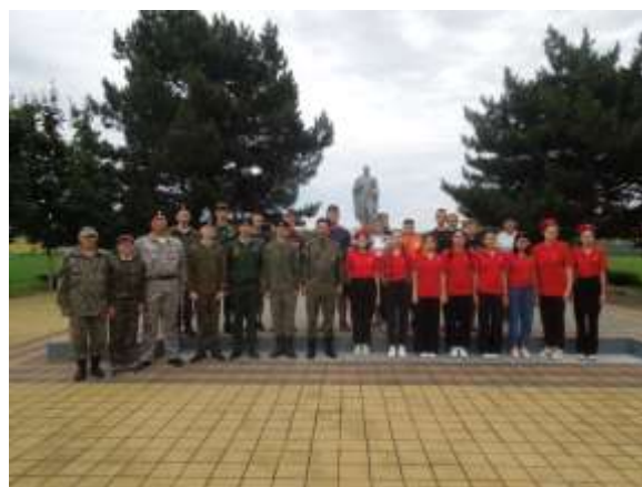
Фото у памятника