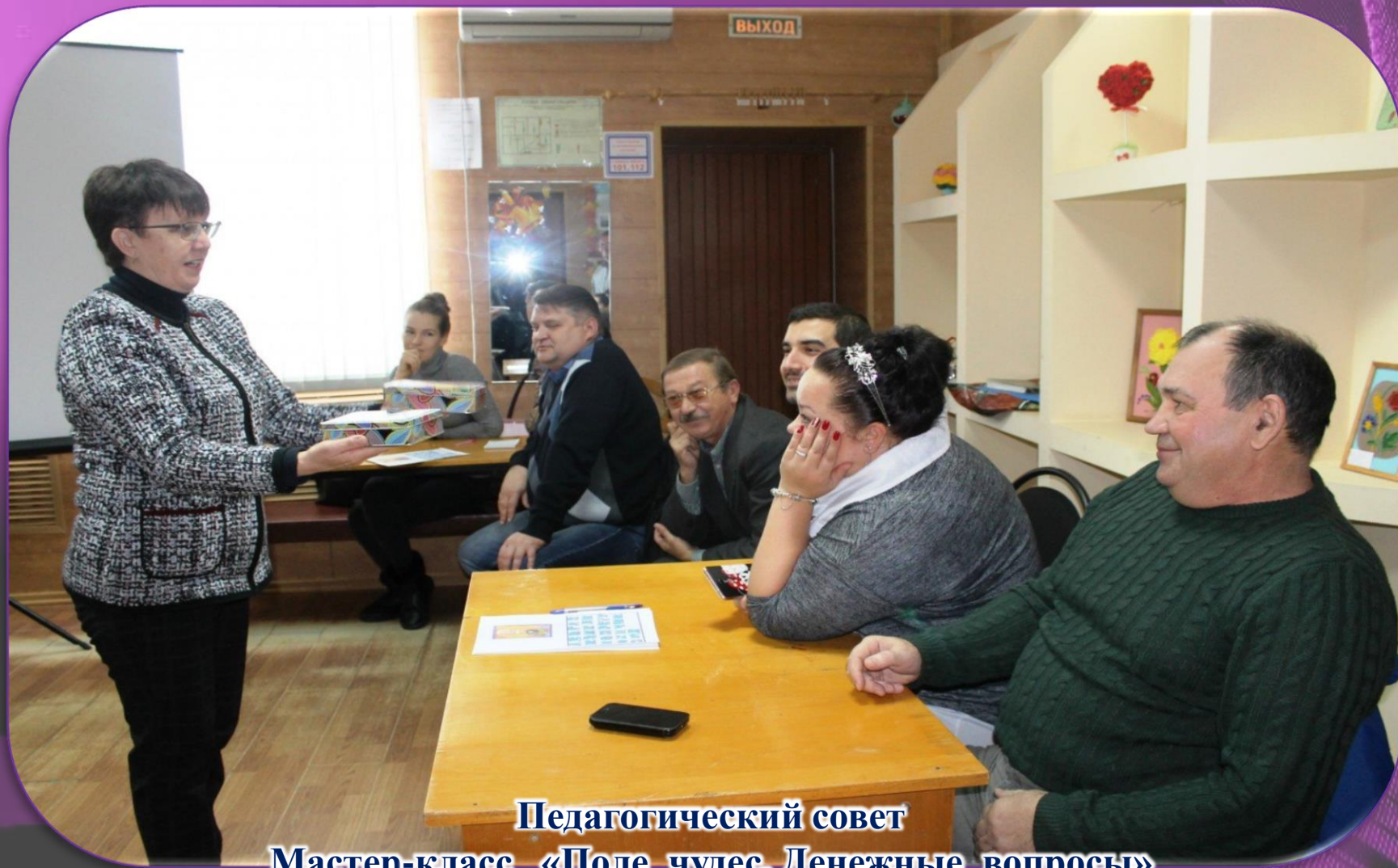
Педагогический совет Мастер-класс «Поле чудес. Денежные вопросы»