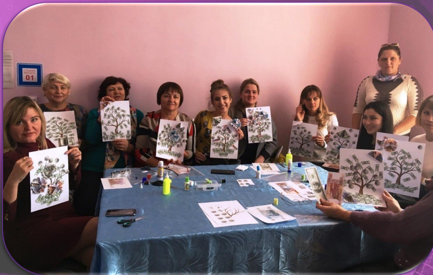
Мастер-класс «Денежное дерево» (педагог Громенко О.Г.)