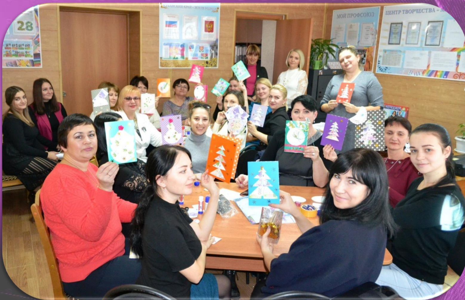
«Интерактивные формы мероприятий обучения финансовой грамотности»: Мастер-класс «Креативная экономика. «Денежная открытка» (04.12.2019 г.)