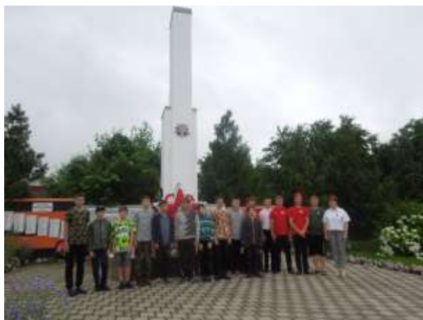
Фото у памятника воинам ВОВ с главой Беднягинского поселения