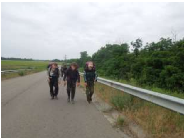
Эх, путь – дорожка