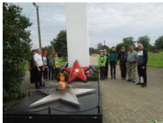
Митинг, посвящённый отправлению группы в поход