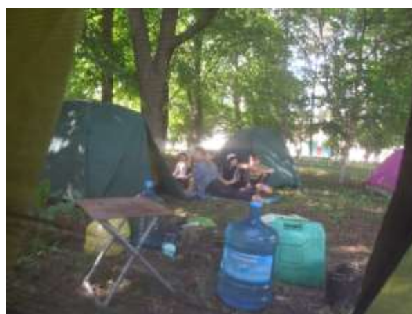
Лагерь х. Большевик