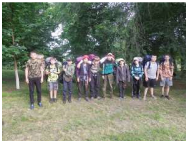
Группа готова к отъезду домой