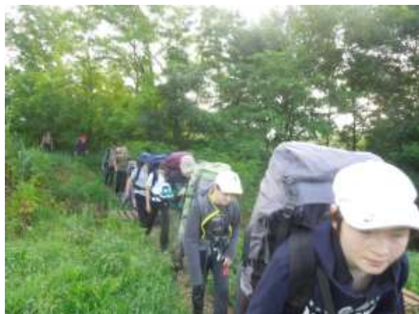
Выход на маршрут