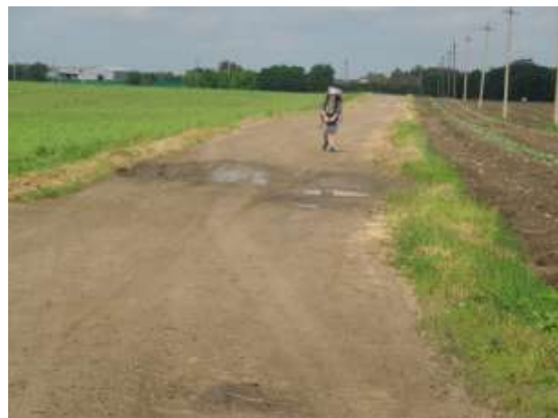
А дорога серою лентою вьётся