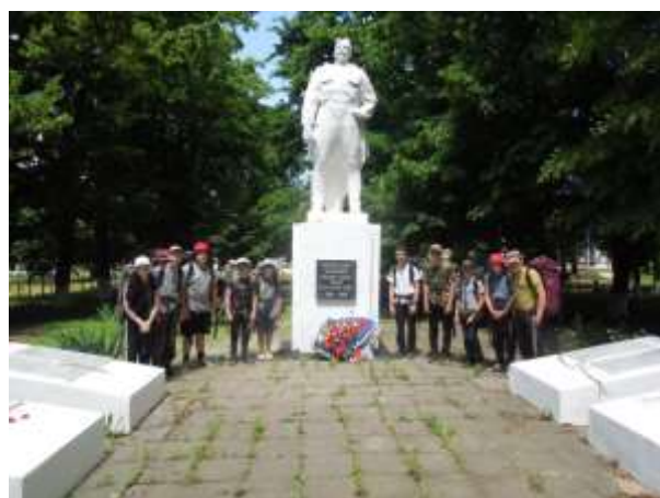
Фото у памятника воинам ВОВ х. Большевик