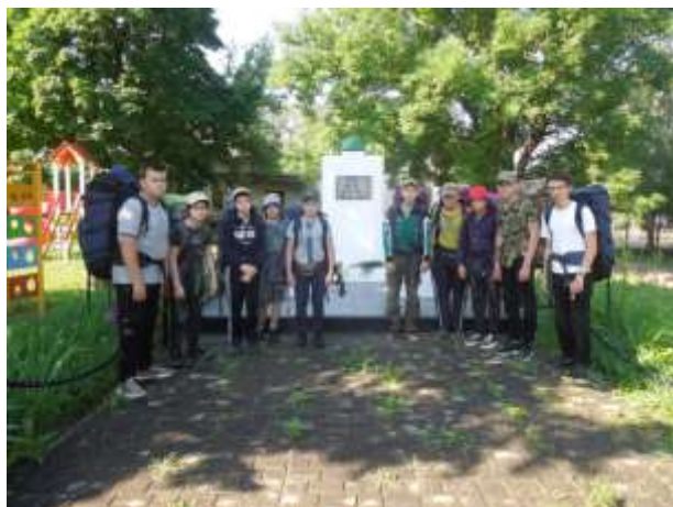
Фото у памятника воинам ВОВ х. Ленинский