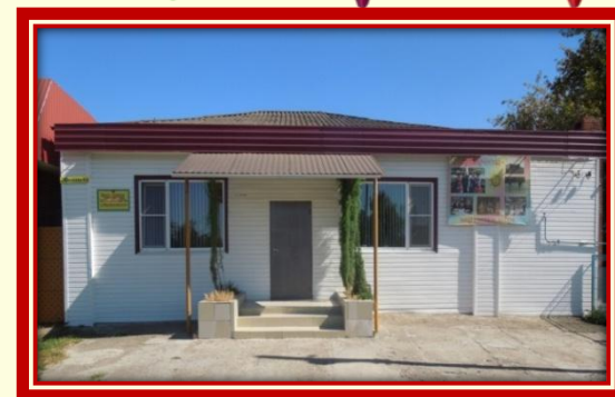
Муниципальное бюджетное учреждение дополнительного образования Центр творчества «Калейдоскоп» муниципального образования Тимашевский район

-3 место в муниципальном этапе краевого смотра-конкурса «Молодые дарования Кубани», в номинации «Изобразительное искусство», 2016г.;