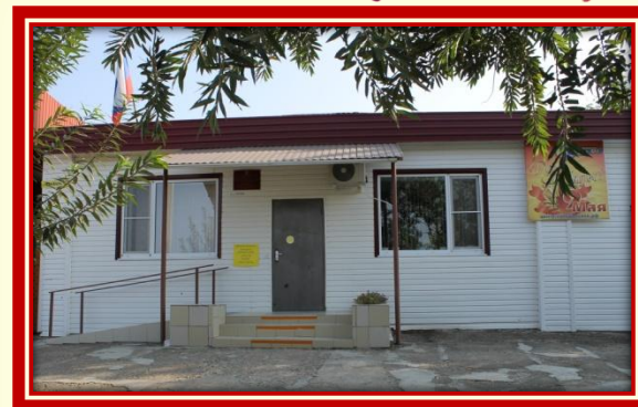
Муниципальное бюджетное учреждение дополнительного образования Центр творчества «Калейдоскоп» муниципального образования Тимашевский район

- Гран-при и 2 место муниципального этапа регионального конкурса «Пасха в Кубанской семье», в номинации «изобразительное искусство», 2017 г.;