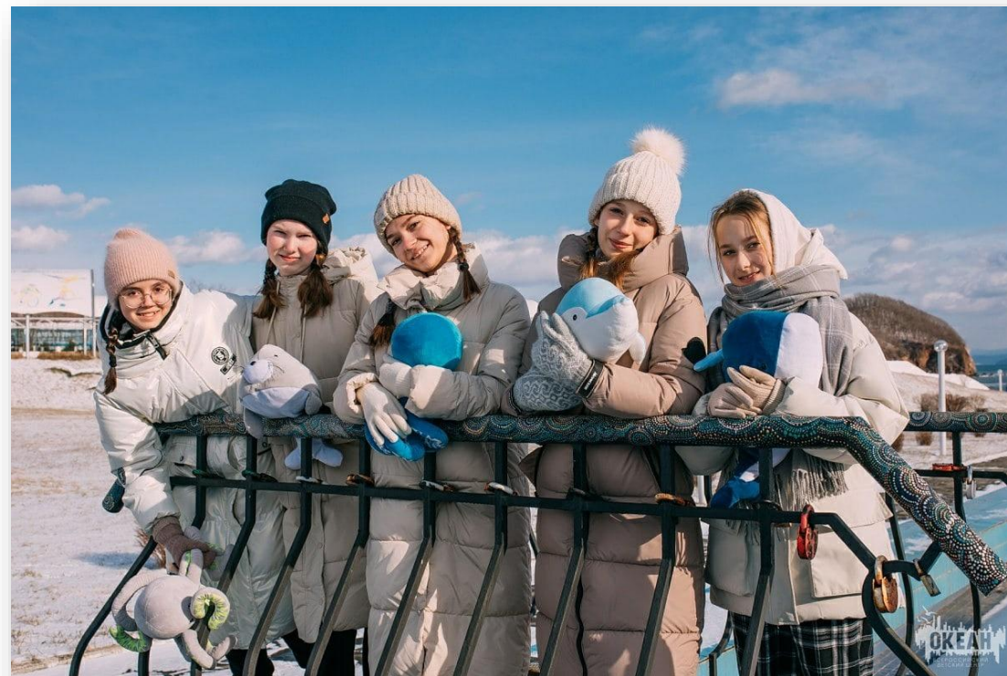
ВДЦ «Океан» (5-18 мая)