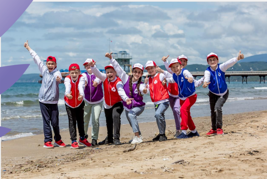
ВДЦ «Орлёнок» (12-25 мая)